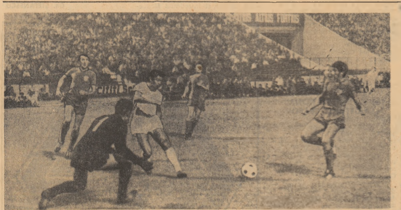
După cum s-a putut constata cu ocazia Cupei Municipiului București, stadionul 23 August este bine pregătit pentru reluarea campionatului Divizion A de fotbal. În imagine, o fază de la cea mai valoroasă partidă a competiției, jocul Sicaua—Dinamo