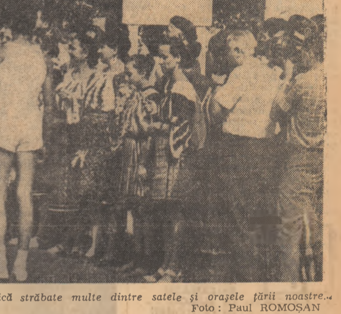
În mijlocul unui entuziasm tineresc, flacăra olimpică străbate multe dintre satele și orașele țării noastre.

TRASEUL FLACĂRII OLIMPICE Miercuri 16 august Stafeta va porni, la ora 7, de la Deva, din fata hotelului Dacia, pe următorul traseu: ZAM (ora 9.10), LIFOVA (11.40), ARAD (13.50), ORTISOARA (16), TIMIȘOARA (16.50), unde va rămîne peste noapte.