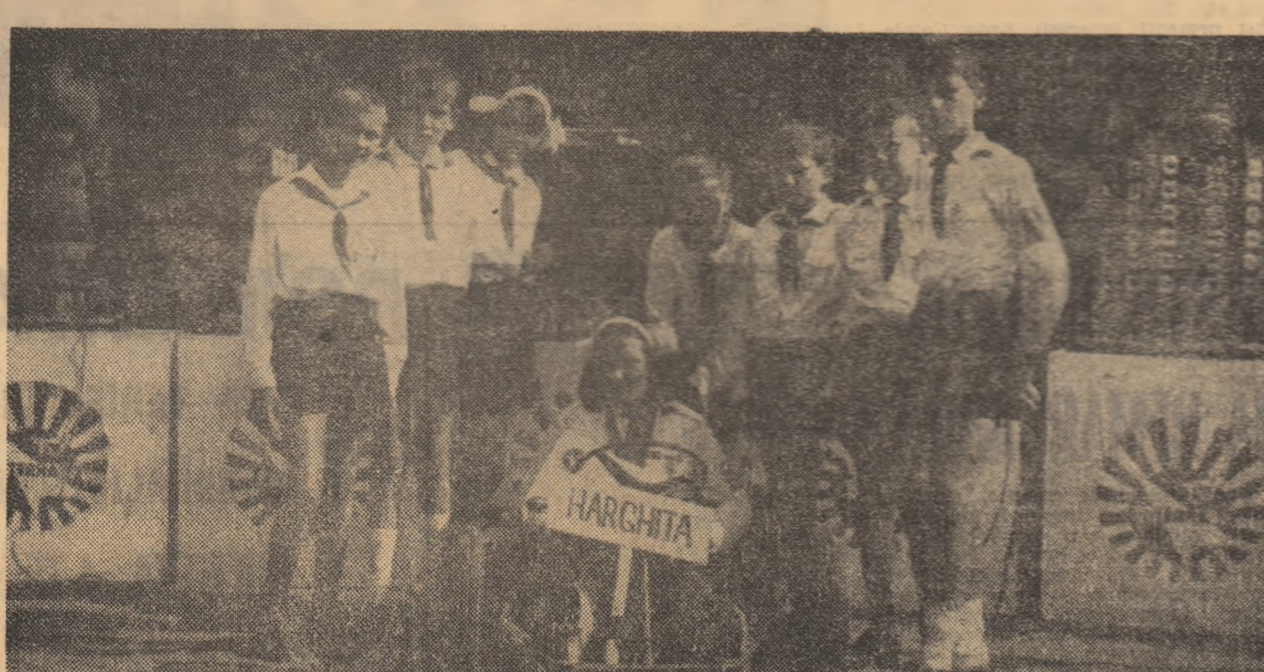
Echipa școlii din Hodosa și „Marele premiu” obținut pentru originalitatea construcțiilor prezentate — un car de curse