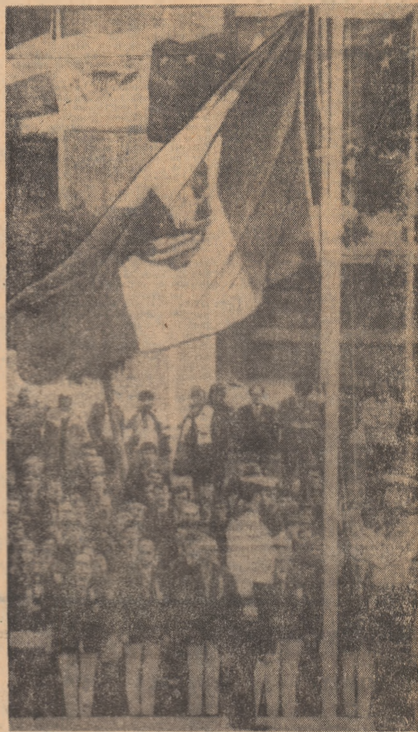
În Satul olimpic flutură drapelul de stat al României.

În prima lor și petrecută în satul olimpic, sportivi români au trăit un moment înalt și cu prețioasă semnificație de ridicare a drapelului României pe câmpul din care să se desfășoare competițiile care îi gîndesc pe olimpici. Duminică după amiază, la ora 15, în curtea unui mare vest-german de fabrica grînzilor, au defilat prin la locurile stabilite din lăsa câmpului sportivii români, urmat de delegații din țările: Ungaria, Brazilia, Noua Zeelandă, Senegalul, Paraguayul și Republica San Marino. În fața școlilor olimpice, primul sătul olimpic, Walter Trüger, a rostit cuvintele de bun venit adresate delegațiilor în parte. Spre surpriza sportivilor noștri, dl. Trüger a prezentat câteva cuvinte de laudă și în românește. Apoi, în timp ce se lăsa înălțat de stâlpii din Republica Socialistă România din marelui din marina federală au înălțat pavilionul României pe câmp. Toți sportivii români pre-