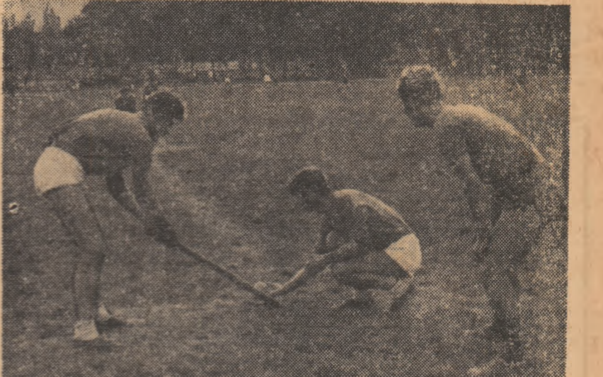
Jucătorii din Frasîn, la „bătaia mingii“, în fața ultimelor speranțe în partida de baraj cu echipa Avintul Curcani, cîștigătoare amfiteatru.

„spart“ blocajul a șase dintre adversari. Condusă cu 12-3 la pauză, echipa din Frasîn a încercat totul pentru a reduce handicapul în repriza de „prindere“, dar s-a lovit de o apărare ermetică, reușind să întărească doar un singur adversar. Superiorii și în jocul la „bătaie“ (5-3), oiniștii din județul Ifov au cîștigat primul meci cu 17-5. Evident sollicitați, jucătorii frasîneni au scîzut în partida a doua frecvența acțiunilor, victoria