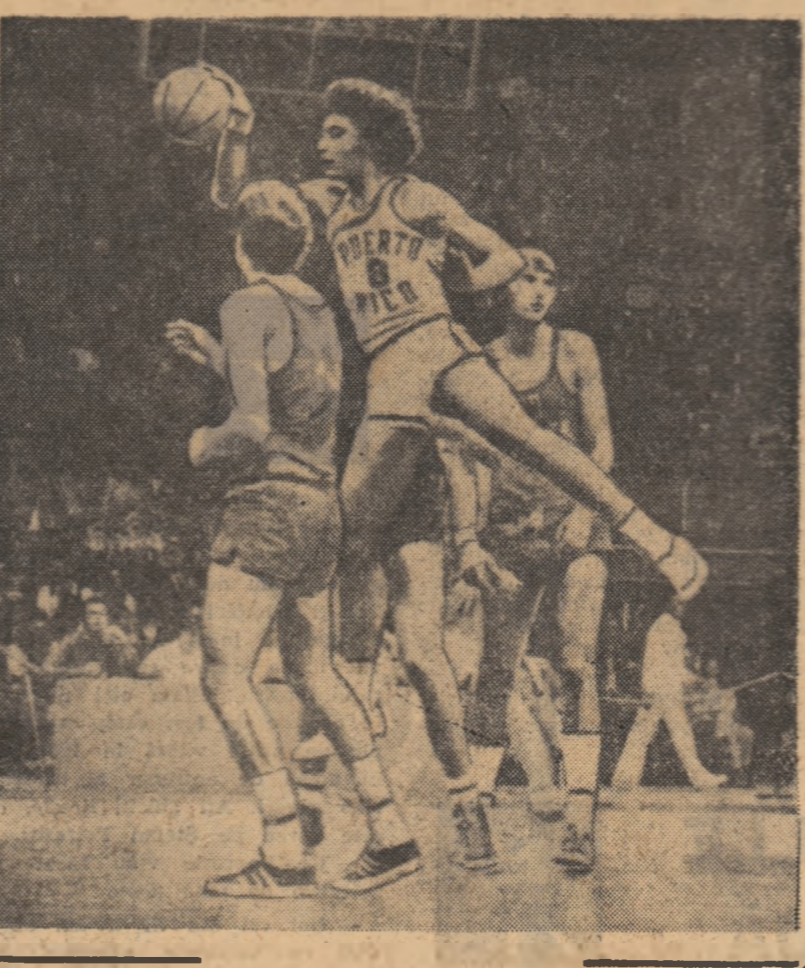
Senzație în turneul de baschet: formația Porto Rico a întrecut-o pe cea a Iugoslaviei, campioana lumii!