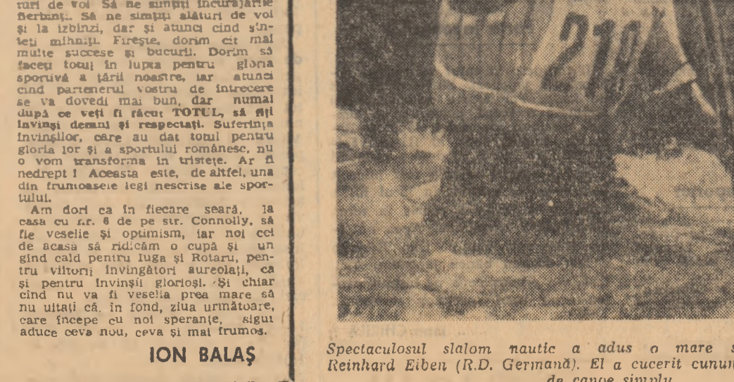
Speciosul slalom nautic a adus o mare satisfacție sportivilor Reinhard Eiben (R.D. Germania). El a cucerit cununa olimpică în proba de canoe simplu.