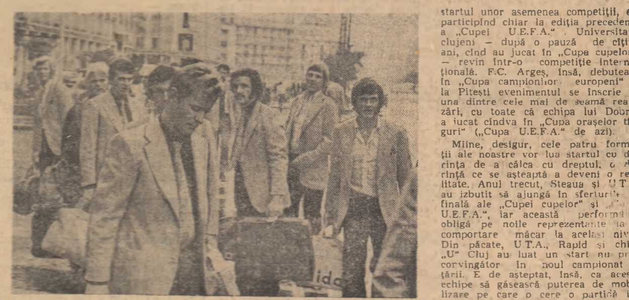
Fotbalisti noștri la București. În drum spre Arad jucătorii de la Năstase și Martinescu au fost ocazia de a merge în Capitală la o surpriză de fotbalierii noștri într-o scurtă plimbare pe un baltăuș al orașului.

startul unor asemenea competiții, ele participând chiar la ediția precedentă a „Cupei U.E.F.A.”. Universitarii clujești — după o pauză de cîtiva ani, cînd au jucat în „Cupa cupelor”, — revin într-o competiție internațională. F.C. Argeș, însă, debutează în „Cupa campionilor europeni” și la Pitesti evenimentul se înscrie ca una dintre cele mai de seamă realizări, cu toate că echipa lui Dobrin a lucrat cîndva în „Cupa orașelor tirguri” („Cupa U.E.F.A.” de azi).