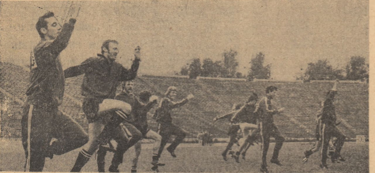
Secvență de la antrenamentul de ieri, de pe stadionul 23 August, al fotbalistilor de la Landskrona.

Fotbalul european își desfașoară astăzi, pe stadioanele tuturor țărilor de pe continent, forțele sale de prim ordin. Incep cele trei competiții care au intrat în tradiția vieții lui, devenind de o asemenea importanță încât, în momentul de față, doar întrecerea pentru „fotoliile” turneului final al campionatului lumii și turneul final însuși le mai depășesc ca amploare și interes al publicului.