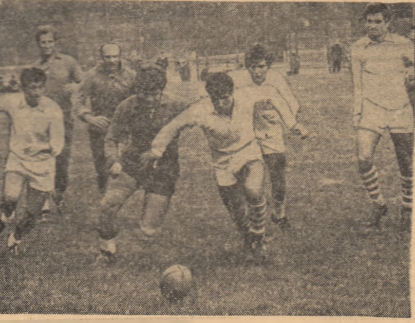
Rugby în manieră... fotbalistică. Dinamoviștii (în alb) susțin as-tăzi, pe terenul Vulcan un nou eșec evident mult mai ușor decât cel cu Steaua (de la care a fost surprins acest instantaneu) jucind cu C.S.M. Suceava...

Basinul de canotaj va fi amenajat într-o zonă apropiată și ea de centrul olimpic. Întrecerile de inhting se vor disputa la Kigston, un