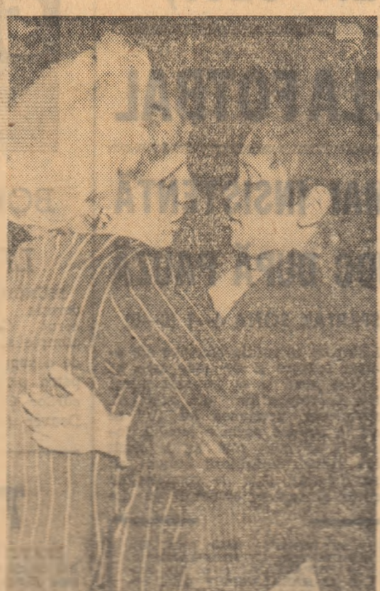
Miștrel Ștebo are o dilemă: ce sport să joace când nu fi mare: polist ca în trecut sau armer ca în prezent? Medalia cucerită de Oipa, în altele competiții, îi vor determina, probabil să opteze pentru florin!