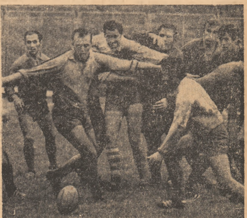
Fază din meciul Dinamo — C.S.M. Suceava, primul din cadrul cupajului bucureștean de pe „Vulcan”

Etapă agitată, cu multe rezultate puțin scontate, iată caracteristica întrecerilor rugbyistice de miercuri. Dinamo a câștigat greu la C.S.M. Suceava. Vulcan a realizat o victorie la capătul resurselor fizice, Poli tehnica și Precizia s-au putut să valorifice avantajul terenului decit pe jumătate. Doar Știința, la Petroșani, s-a detașat în fața unui adversar — Sportul studențesc — care nu reușește pînă în prezent să evolueze la valoarea lotului de care dispune.