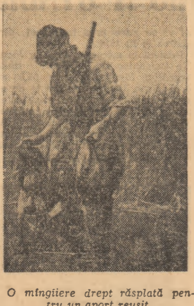
O mângiere drept răsplătire pentru un aport reușit