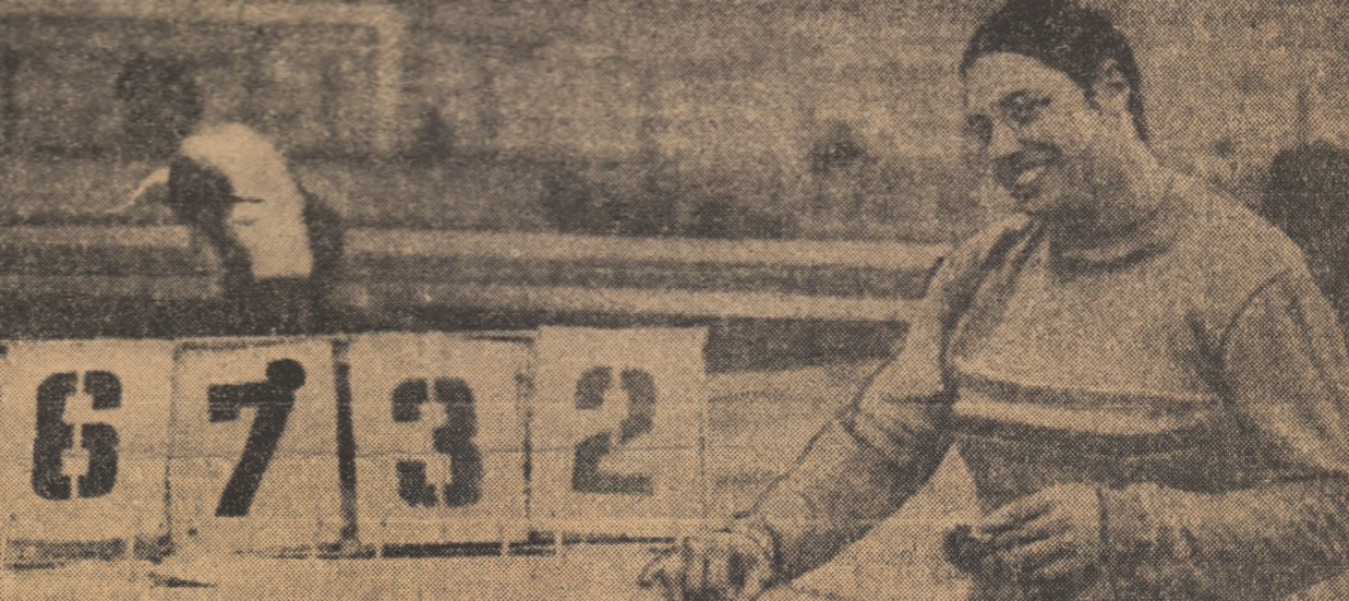
Cea mai frumoasă fotografie pentru albumul Argentinei Menis

Juniorii noștri au învins formația Poloniei și au realizat trei noi recorduri naționale