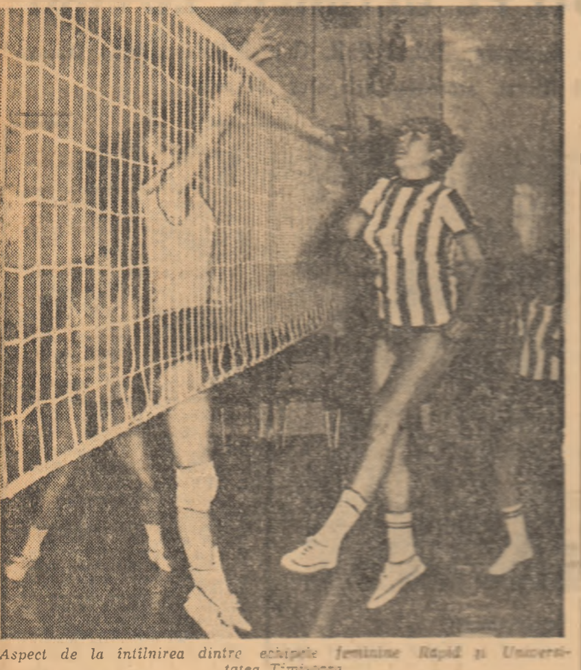
Aspect de la intalnirea dintre echipele feminine Rapid si Universitatea Timisoara