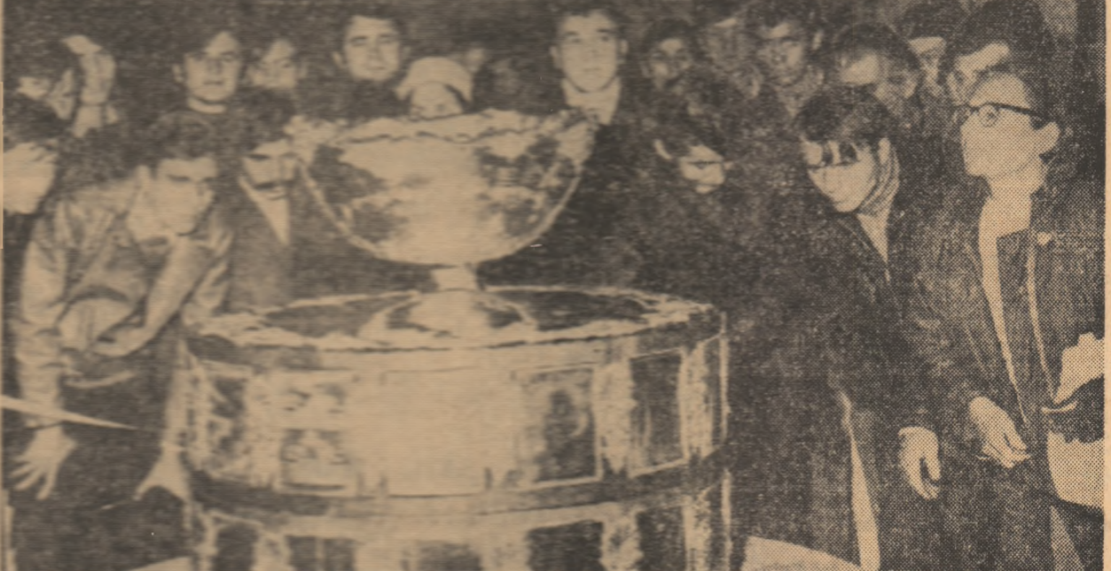
Aflanșul de antrenor la prima etapă a „Salatiera de argint” în fața publicului bucureștean.

Pentru aceasta am încercat să ne edificăm, consultând specialiștii meteorologici. Iată și răspunsul ce ni s-a dat la Institutul Meteorologic Central: „Pentru următoarele zile vremea se va ameliora ușor, cerul rămânând însă variabil. Vântul va slăbi în intensitate, iar temperatura va înregistra creșteri ușoare”. Deci, semne bune!