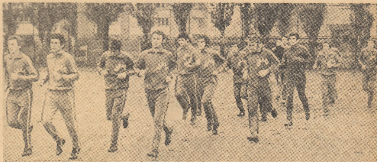
O scurtă „încalzire” a selecționabililor, înaintea jocului-școală cu Dinamo tineret.

● Ieri, selecționabilii s-au antrenat cu Dinamo-tineret ● Roznai a înscris două goluri și... promite ● Antonescu, un jucător sobru, pe urmele lui Lupescu?