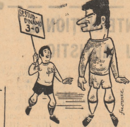
„Nea Sătmărene, și cei din urmă vor fi cei dinții...” clasamentul interbucureștean!!!