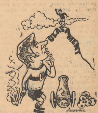
OBLEMENCO: - „O! mai ajunge pînă la ei?”