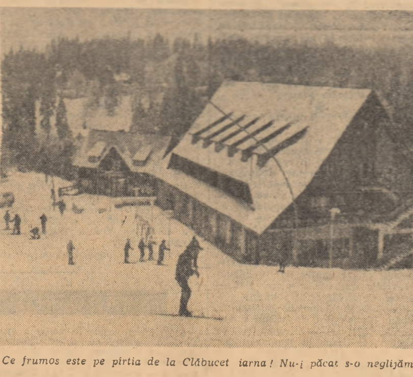
Ce frumos este pe pîrtia de la Clăbucet iarna! Nu-i păcat s-o neglijm?

conduce în turul actual. Acum, despre meciurile de azi (n.r. ieri): STEUA — DUNĂREA GALAȚI 6-1 (1-0, 1-0, 4-1) Meci echilibrat, cu multe ocazii ratate de ambele părți. Era evident că Steua își păstra forțele pentru derby-ul de duminică, cu Dinamo. Trebuie însă menționat și jocul curajos și gălătos al echipei militare Steua, respectiv Trășanu. Au arbitrat bine și autoritari P. Kovacs și A. Balint (ambii din Miercurea Ciuc). DINAMO — S.C. M. CIUC 4-2 (1-2, 2-0, 1-0) Au marcat: Bondas, Pană, Huțanu și Tureanu de la Dinamo, respectiv Gall și Rusev de la Sport Club. Au arbitrat corect și autoritari Fl. Gubernu (București) și G. Tănăsiu (Miercurea Ciuc). Zoltan MORYAY — coresp.