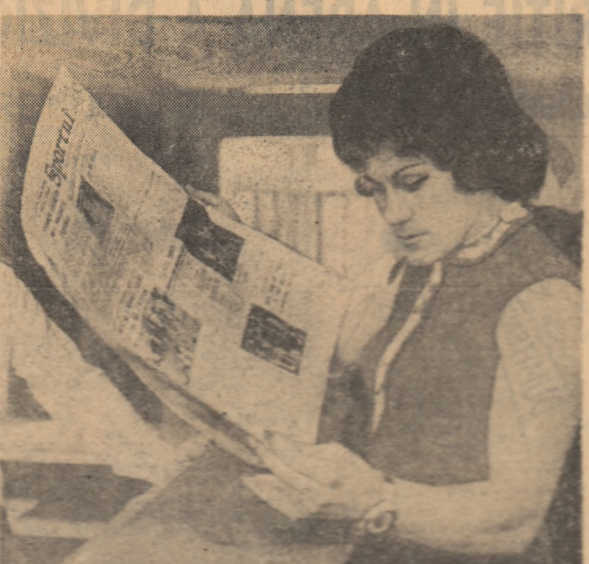
Campiona olimpică de la München cerevenca de aruncare „Sportul” pentru a afla noi țări din atletism.

— Este foarte greu de explicat și mult mai ușor de simțit, acolo, atunci în concurs. Vedetă de în momentul cind intensității ca pot risca, cind dobândesc apăsător și apoi termina invingător, trebuie doar să îndeplinești exact ce-ai deprim în nenumăratele ore de antrenament. Să pui, cu alte cuvinte, în concordanță teoria cu practica. De aceea nici nu concep acum o pregătire psihologică făcută în vederea unui singur concurs. Am simțit-o pe pielea mea cind, trecind prin momente mai grele în activitatea sportivă, eram gata să aban-