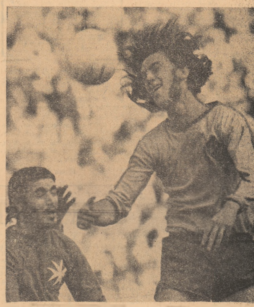
Suedez Edström, autorul a patru goluri în meciul cu Malta din preliminariile C.M. (Suedia — Malta 7-0) este marea vedetă a fotbalului scandinav. Iată-l, înscrisur în gol cu capul în poarta maltezoilor.

În preliminariile C.M. s-a desfășurat în localitatea Alzette (Luxemburg) meciul din preliminariile C.M. dintre selecționatele Luxemburgului și Turciei. Întîlnirea s-a încheiat cu o mare surpriză. Au câștigat fotbalistii din Luxemburg cu 2-0 (2-0).