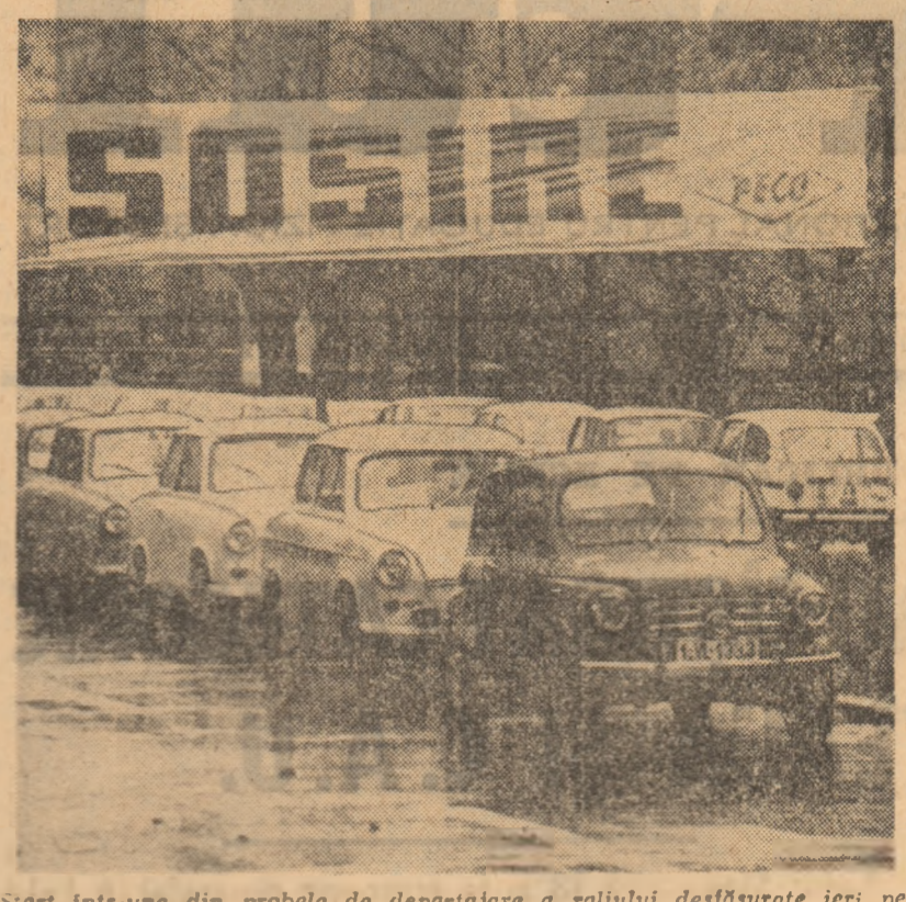
Start într-una din probele de departajare a raliului desfășurate ieri pe străzile Capitalei

V. SECAREANU - coresp. REZULTATE TEHNICE: Steaua - Vulcan 16-6 (8-0); Dinamo - Știința Petroșani 0-0; Precizia Săcele C.S.M. Sibiu 4-4 (0-0); Rulmentul Birlad - C.S.M. Suceava 14-6 (14-0); Farul Constanța - Universitatea Timișoara 0-3 (0-0); Politehnica Iași - Sp. Studențesc 7-7 (4-3); Gloria - Grivita Roșie 3-3 (3-3).