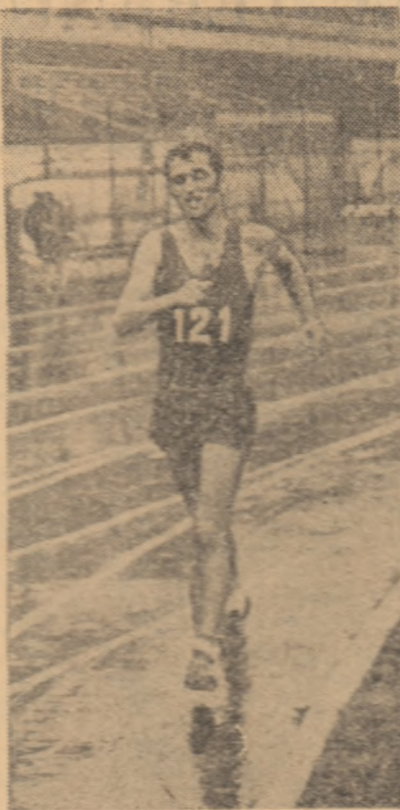
În găsitu în timpul cursei de 10 km marș pe care a încheiat-o într-un timp excelent: 43:49,0.