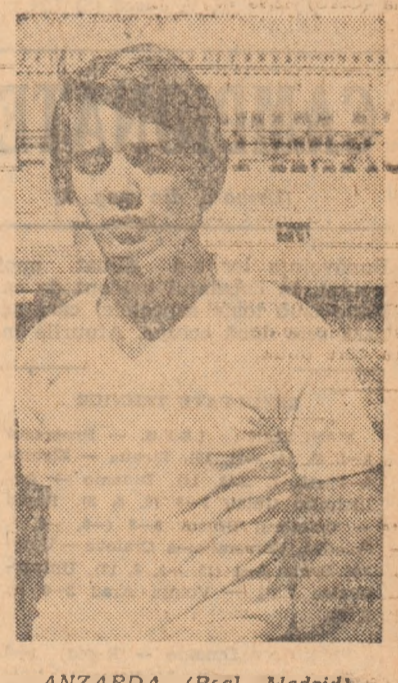
ANZARDA (Real Madrid)