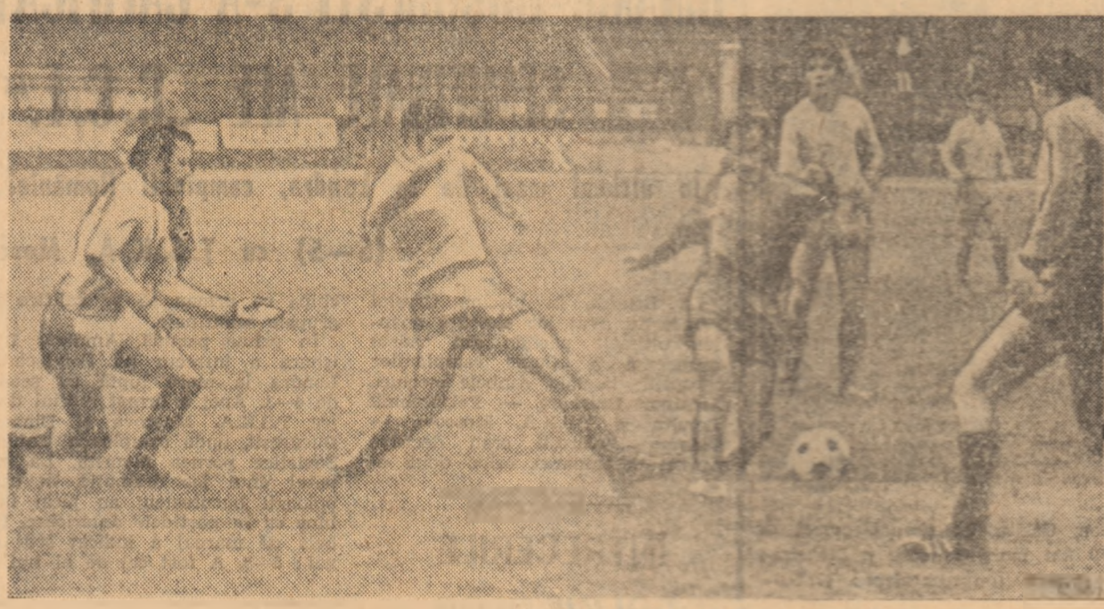
O nouă acțiune de atac a gazdelor, care se va sparge de „zidul” apărătorilor constănțeni (Jază din meciul Petrolul — Farul disputat ieri la Ploiești)