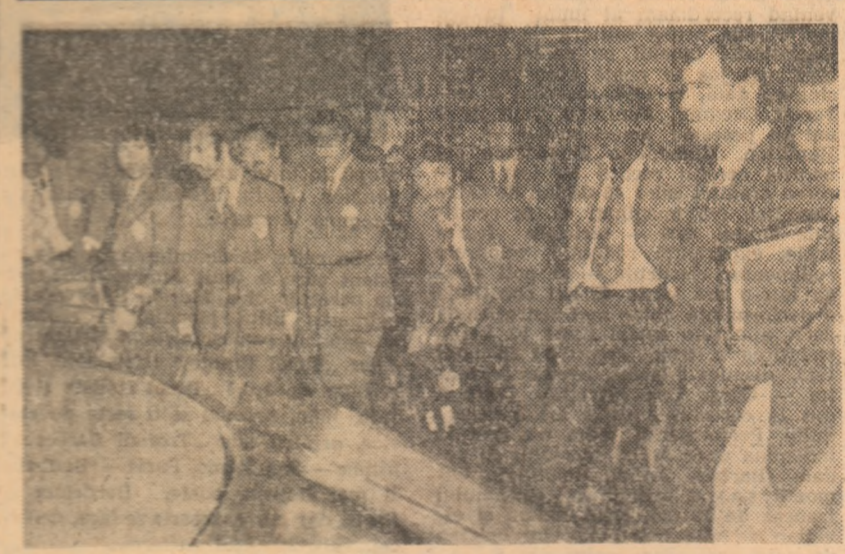
Fotbaliștii de la Gaurani, la sosirea pe aeroportul Otopeni

etapa a VII-a) și 3 cu primii cinci state, iar 5 cu patru. • Partidele acestei etape au fost urmărite de 118.500 de spectatori. Cel mai mult (30.000 — recordul campionatului) au urmărit meciul Rapid-Dinamo, iar cel mai puțin, 2.500 au fost prezenti în tribuna stadionului „23 August” la partida Steaua-Sportul studențesc. • Clasamentul echipei, după opt etape, pe baza mediei de spectatori — cifră aproximativă — arată astfel: 1. CRAIOVA 14.833; 2. București 14.311; 3. Pitești 13.750 etc. • Situația în „Tribuna Piteștorilor”, după opt etape, este următoarea: 1. PITEȘTI 9.33; 2. Cluj 9.11; 3-4. Bacău și Fierăș 9,10 etc.