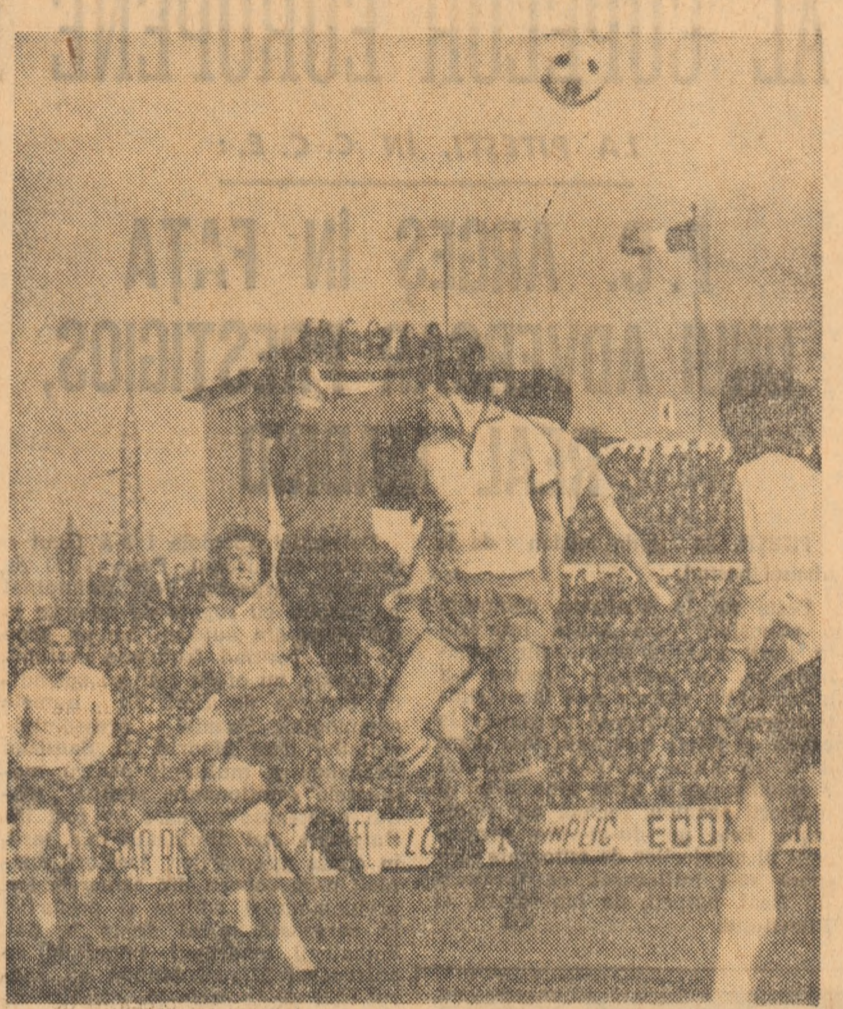
U.T.A. înseamnă o filă de istorie în fotbalul românesc