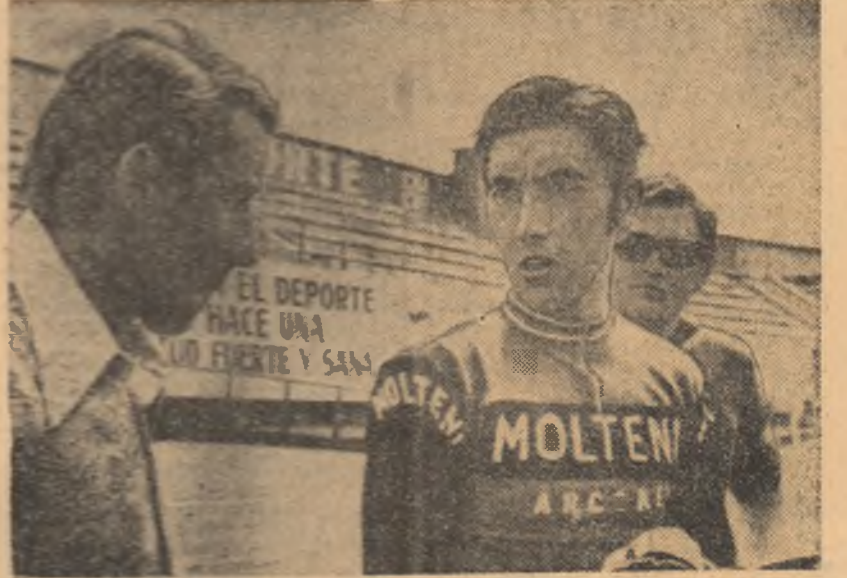
După ultimul antrenament, efectuat pe velodromul olimpic din Ciudad de Mexico Eddy Merckx discută cu fostul recordman al orei, francezul Jacques Anquetil.

Născut la 17 iunie 1945 la Meensel Kiezegem (Belgia), Eddy Merckx — cel de la care se așteaptă din clipă în clipă un nou record al lumii în