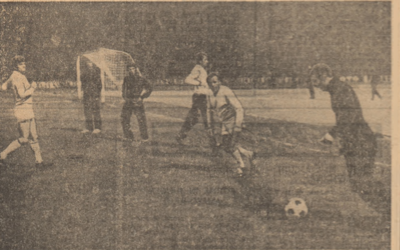
Aspect de la antrenamentul fotbalistilor albanezi, efectuat vineri pe stadionul „23 August”, la Jurnala reflectoarelor.

Înainte de plecarea spre București, antrenorul reprezentativilor R. D. Germane a declarat că, după opinia lui, întâlnirea de la București este foarte importantă pentru desfășurarea pe mai departe a întrecerii din grupe a IV-a preliminară. „Cred, a spus Buschner, că selecționata Albaniei va face totul spre a recupera terenul pierdut prin înfrângerea de la Helsinki, după cum selecționata României nu se va menaja spre a pierde impresia arelei egal neașteptat din fața reprezentativilor finlandezi. Eu, unul, socotesc că selecționata Albaniilor are șanse de a lupta pentru primul loc în grupă. Programul ei, cu trei meciuri consecutive pe teren propriu mi se pare foarte avantajos, din punctul său de vedere”.