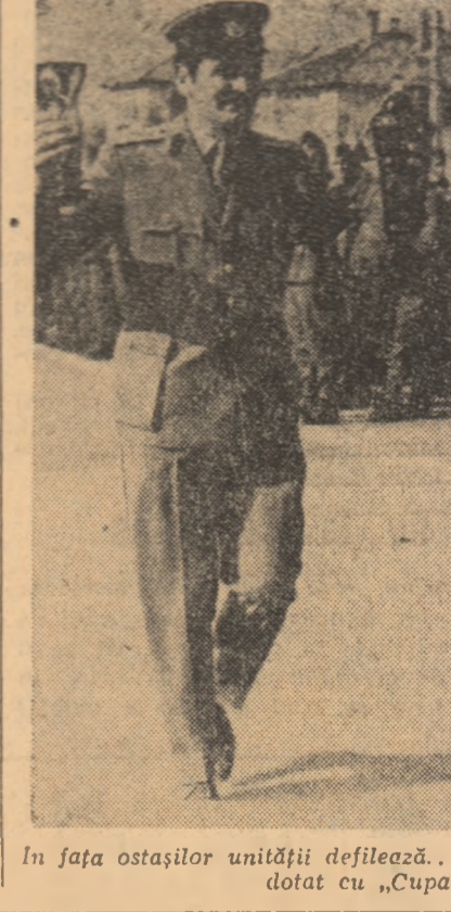
În fața ostașilor unității defilează... cupele cîștigate în cadrul concursului dotat cu „Cupa Apărarea Patriei”