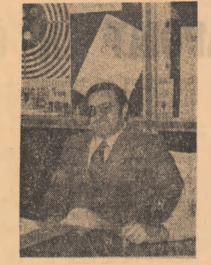
Campionul olimpic la talere Angelo Scalzone (Italia) în vizită la Federația română de tir.

Cum spuneam, Scalzone a venit acum pentru a cincea oară în România, dar niciodată pentru a par-