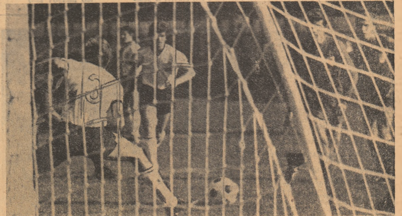
Iordănescu (mască de Anca, purtătorul tricoului nr. 3) deschide scorul în meciul Steaua - „U” Cluj. Atacantul bucureștean avea să „recidiveze” în finalul partidei.

● Jiul, la egalitate de puncte cu deținătoarea primului loc ● Primele nouă echipe pe distanța a două puncte ● Roznai a marcat și în această etapă ● Numai 13 goluri în opt jocuri pe terenuri bune