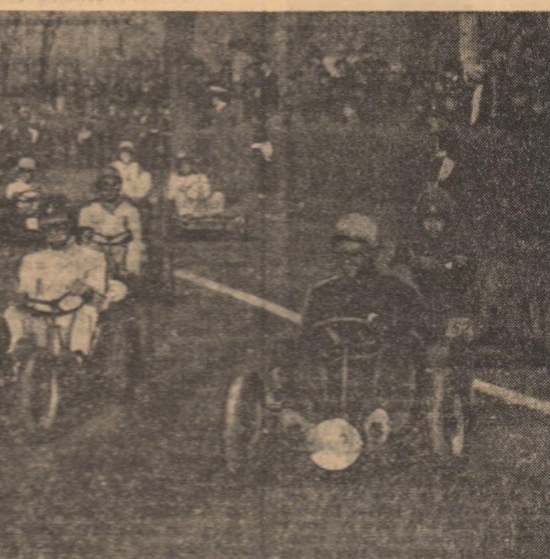
DE LA I. E. A. B. S.

Biletete de intrare la meciurile de fotbal dintre echipele Rapid București și Rapid Viena, ce se desfășoară miercuri pe stadionul „23 August”, se pot înlocui cu bilete de intrare la meciurile de fotbal „Stoian „23 August”, Republică Loto-Prensport, Giulești, Dinamo, C.N.E.F.S., cu program de funcționare între orele 9-20.