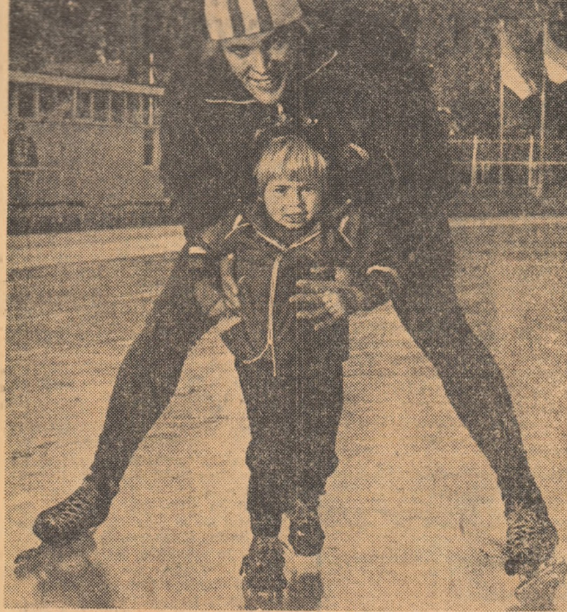
Multiplul campion și recordman mondial de patinaj viteză, olandezul zburător Ard Schenk, este gata să-și reia periplul pe pistele de gheață. Iată-l împreună cu un posibil viitor performer, băiețelul său de 4 ani, Norman, în timpul unei pauze de antrenament.

La Stockholm, au început întrecerile preliminare ale penultimului turneu din cadrul Marelui Premiu — E.L.T. Iată primele rezultate: Stockholm (S.U.A.) — Aberg (Suedia) 6—3, 6—3; Palm (Suedia) — Di Matteo (Italia) 6—1, 6—3; Barrazzuti (Italia) — Rosberg (Suedia) 6—2, 6—3; Enger (R.F.G.) — Zugarelli (Italia) 6—4, 6—2; Norgern (Suedia) — Holmsäter (Suedia) 6—4, 7—6. Pilici (Iugoslavia) — Adison (Australia) 6—7, 6—1, 6—4.