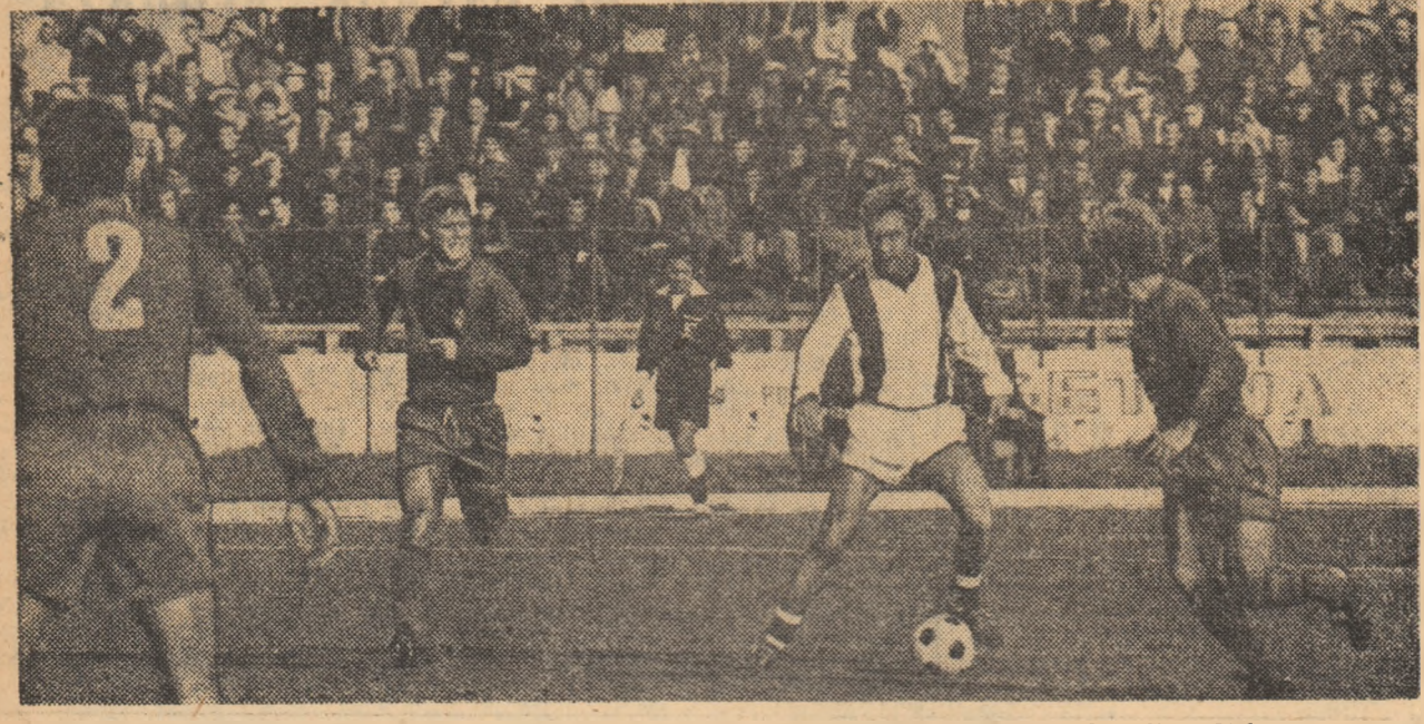
Prepregnel, semnatarul victoriei de la Pit-ti, va fi din nou în luptă miinecu Amancio, Santillana, Velasquez et co.

Alte rezultate: Phillips Moore, Parun — Filton, McManus 6-4, 6-4; Baticric, Ritchey — Pala, Zednik 6-0, 6-2; El Shafiq, Fairlie — Andersson, Carlstein 7-6, 6-1.