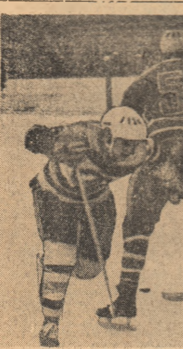
Întîlnirea I.P.G.G. — Agronomia Cluj, disputată ieri dimineață, a constituit partida principală a turului I din grupa secundă. În fotografie: echipa bucureșteană înscrie cel de al doilea gol. (Citiți cronica în pag. a 3-a).

doar ore de joc plecthor, în care competitorii s-au întrecut în greșeli, victoria a revenit giulestienilor cu 3-2 (9, 12, -7, -10, 14), dar nu se poate spune că ei au câștigat, ci că Progresul a pierdut. Este adevărat că elevii lui Drăgan