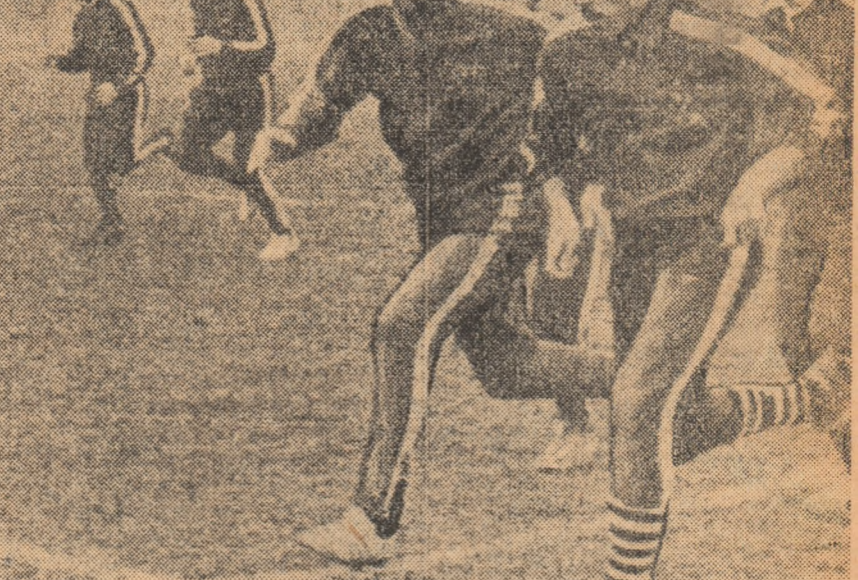
Ieri dimineață, rugbyștii echipei R. F. a Germaniei au efectuat ultimul antrenament înaintea partidei de azi.