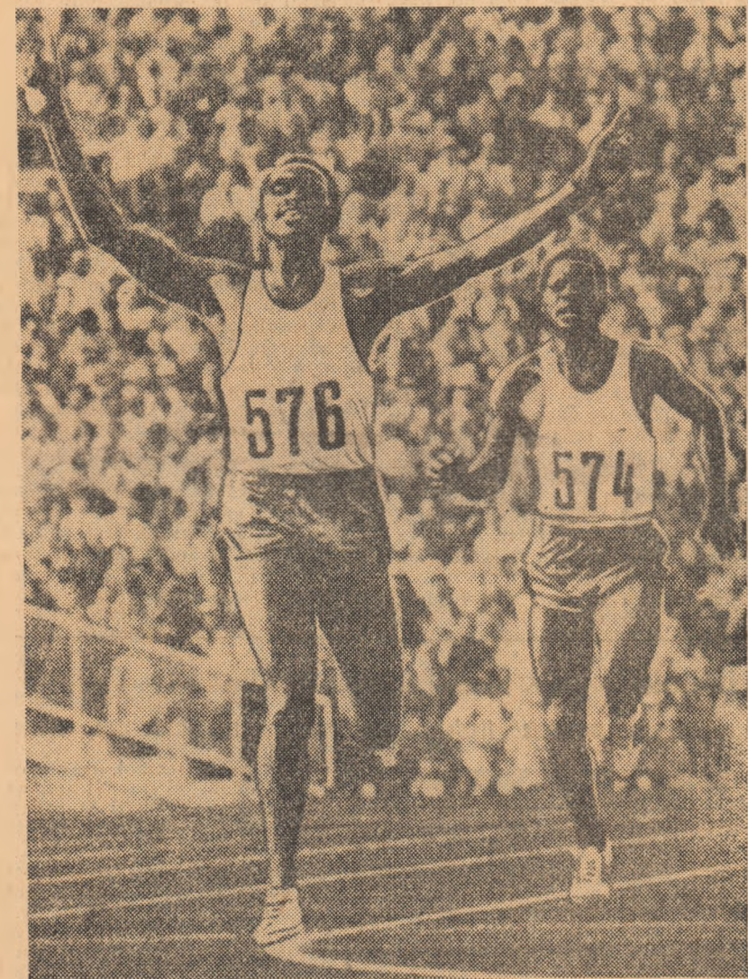
Keino cîștigă pe stadionul din Mînchen titlul de campion olimpic în proba de 3000 m obstacole după numai 4 luni de pregătire în această specialitate.

forțele sale. Totuși, în singurătatea sa, el are mare nevoie de încurajările și de sprijinul moral al celor care-l înconjoară”.