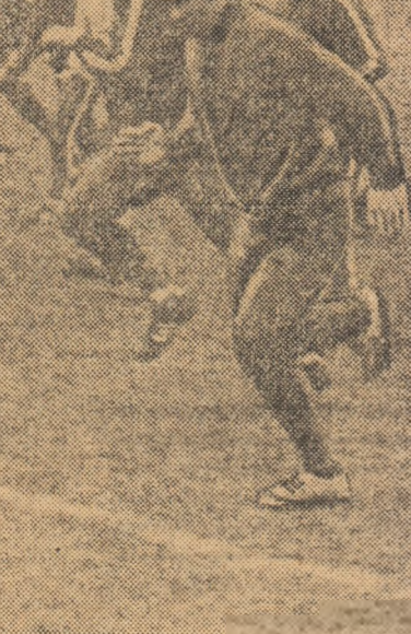
Ieri dimineață, rugbyștii echipei R. F. a Germaniei au efectuat ultimul antrenament înaintea partidei de azi.

R. DEMIAN: „Jucătorii din R.F. a Germaniei sînt bine dotați fizic, au o statură corespunzătoare și ca-