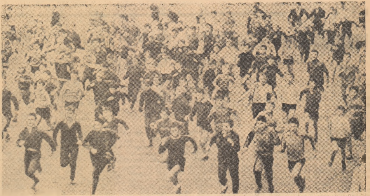
S-a dat startul în întrecerea celor mai mici participanți: băieți între 11 și 13 ani.