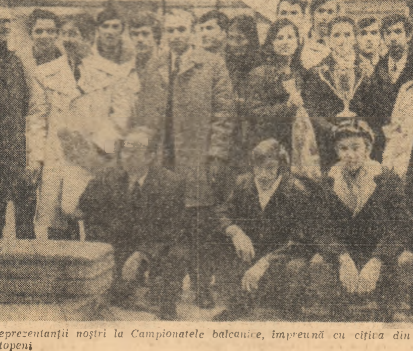
Reprezentanții noștri la Campionatele balcanice, împreună cu cîțiva din antrenorii lor, în holul aeroportului Otopeni.

— La băieți a cîștigat echipa Ungariei —