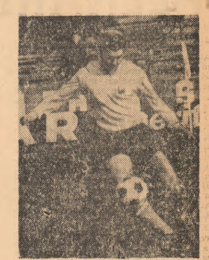
ultimele cuvinte. Cind l-am spus că l-a egalat pe Albu la selecționări, satisfacția l-a luminat chipul: — Mă bucur așcu că snt primul din nolle generații care se apropie de performanța în materie a renumiților noștri înaintași. Sincer vorbind, este un motiv de mândrie pentru mine, dar și de stimulare. — Speri la mai mult?... — De ce nu? Vreau să-l ajung și pe Bodola, ba chiar să-l întrec. — Dar al să poți? Știi, cind mai al puțin pină la potou parcă tocmă atunci e mai greu... — Eu cred că da. Mai am ani de jucat și mă simt în stare să atac și recordul lui Bodola. Perspectiva această mă îndeamnă la o pregătire și mai serioasă, cum din acest punct de vedere nu cred că mi se poate reproșa ceva, sper ca în 1974, poate chiar în 1973, să fiu cap de listă ca selecționări. In fond, este vorba de 6 meciuri pentru egalare și de 7 pentru depășire: snt încă în puteri ca să candidez în următorii doi ani, cel puțin, la unul din posturile de extremă din echipa națională. — Nu crezi, însă, că în această tentativă de record îți pot fi încurcate socotelele de colegii de generație? Sătmăreanu, de pildă, are 39 de selecționări, Dinu, Dobrin și Radu Nunweller cele 34. Si ei snt tineri, dacă nu chiar mai tineri ca tine. — M-ar bucura să fim mai mulți cei care atacă acest record. Concurența dintre noi ar duce în mod și mai sigur la doboricrea lui. — I-am urât succes acestui excelent sportiv pentru care a îmbrăcat de cele mai multe ori tricoul național reprezentativ o mare satisfacție. Și Mircea Lucescu a știut să onoreze de fiecare dată cîstea de a fi selecționat în reprezentativă. — Să vedem însă, ce spune și el, pentru că — la urma urmei — el are