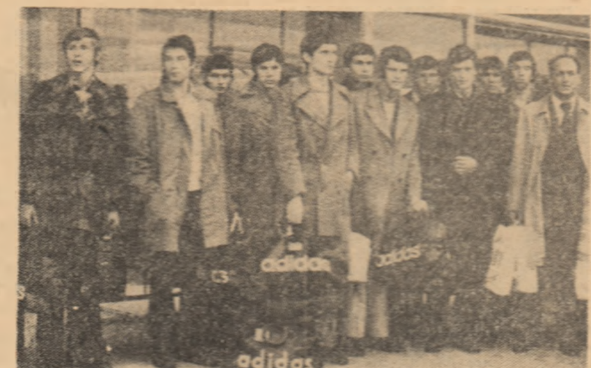
Juniorii iugoslavi, la puțin timp de la sosirea lor pe aeroportul internațional Oropeni.

Solicitîndu-l un prestigios antrenorului principal, Constantin Ardeleanu, acesta ne-a spus: „Vom face totul pentru ca debutul în grupa noastră preliminară (a n. din care mai face parte și selecționata Gre-