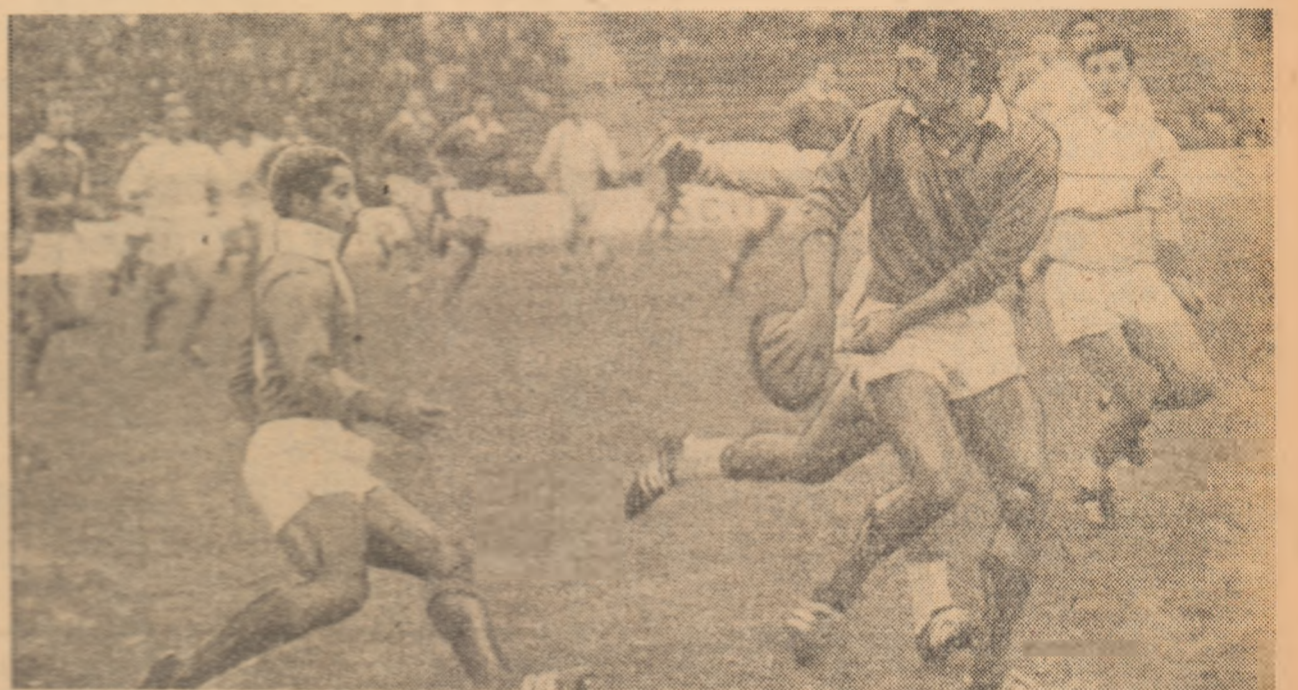
Trillo și Bourget, „piese de rezistență” ale francezilor, în acțiune