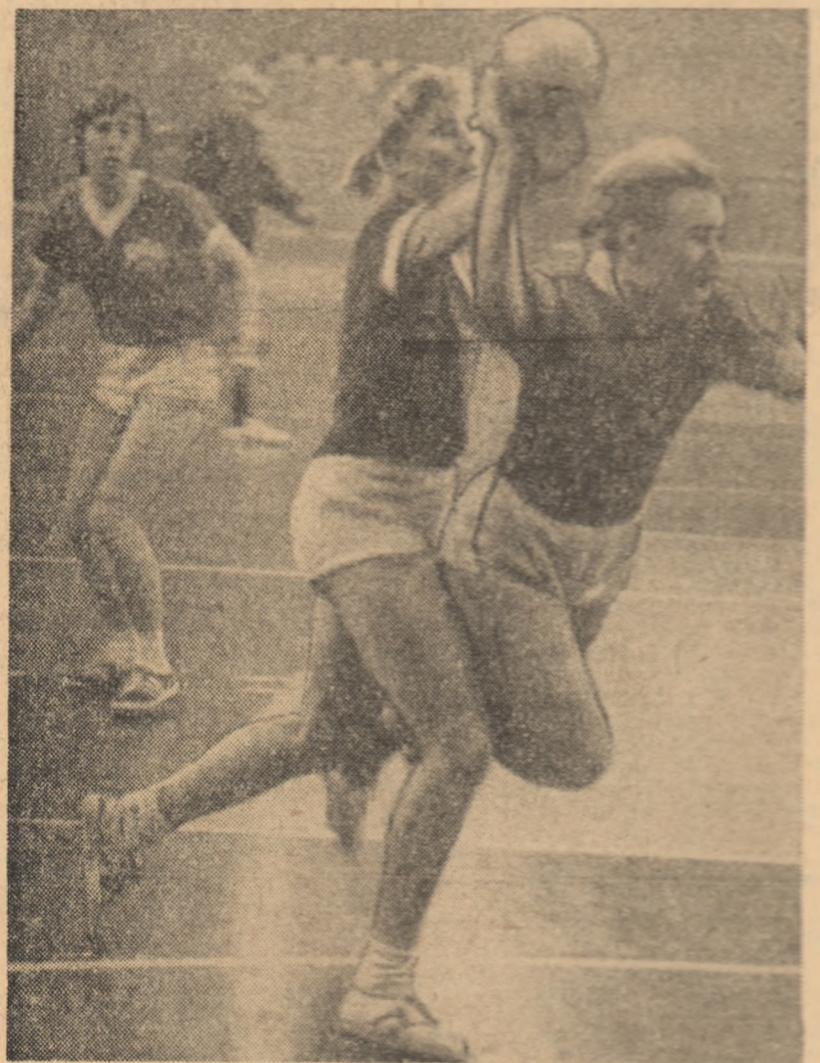
Moment dramatic la poarta echipei R.D. Germane, Lozbinia (Uniunea Sovietică) nu mai poate fi oprită din acțiunea sa și va înscrie. Fază din meciul R.D.G. — U.R.S.S. încheiat la egalitate: 8-8.

ganizațiile cu atribuții în acest important domeniu al vieții noastre sociale. Au fost stabilite, totodată, obiectivele activității de masă și de performanță ce vor trebui să fie îndeplinite în viitor. În încheierea dezbaterilor a avut cuvîntul tovarășul Jean Tudor, secretar al Comitetului județean de partid.