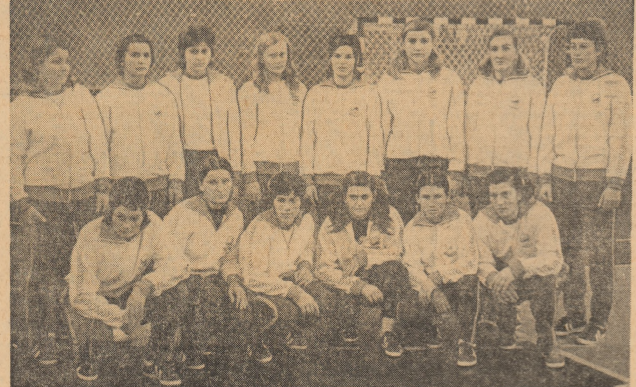
Handbalistele române învingătoare în cea de-a XIII-a ediție a „Trofeului Carpați”.

Îți mulțumim pentru că ne-ai primit cu ospitalitate milenară a blajinilor dar dirzilor moldoveni, ne-ai încântat cu gratul moldo-com ca și Obocinele Dornei, ai celor ce l-au slăvit pe Ștefan, ne-ai scos în cale la tot pasul istoria, umindu-ne pe ieri cu azi, printr-o strădanie măiestră de penel. Piața Unirii, Casa Domnească, Biserica lui Creangă, Turnul Gării, Tret Izarilor, Copoul lui Eminescu, atâtea și atâtea locuri cu profunde rezonanțe în istoria și cultura țării, formeză astăzi, laolaltă cu zveltele edificii ale socialismului contemporan — un ansamblu monolitic, impresionant strălucit de Nicolina și ecurile ei. Fete tinere, Jin d'ferite țări ale Europei, au venit aici „în dulcea țigă al leșilor” să caute acea „fata morgana” care este gloria sportivă. S-au bucurat, însă, deopotriva să-ți descifreze tainele trecutului și să-ți admire tinerețea fără bătrânețe, te-au felicitat entuziasmate pentru paginile noi pe care le scrii în istoria acestei țări. În fiecare zi a acestei săptămâni din pragul Ierii îți-am simțit căldura, și-ți mulțumim!