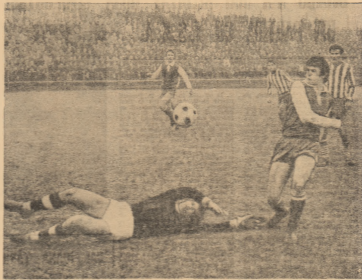
Kun ratând interceptia balonului pe care Domide, peșt din armă, îi nu introduce totuși în plasă egalind și trupa în min. 35. (Fotă din serialul Autohazur-UTA.I.)