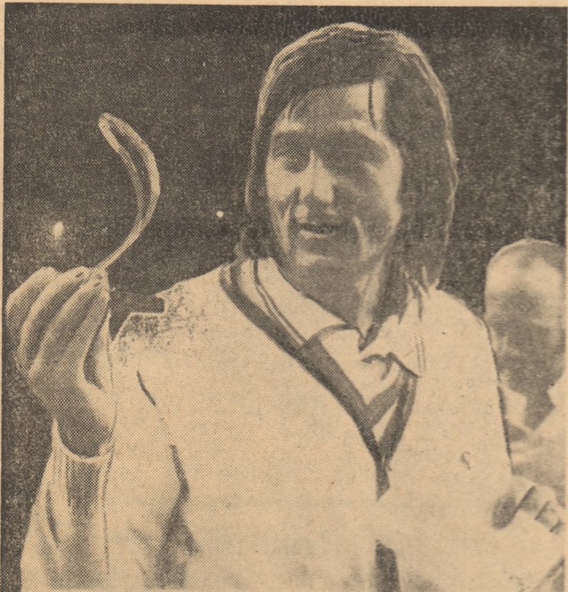
Ilie Năstase, la cîteva clipe după ultima minge a meciului, securindu-şi victoria

● Aprecieri măgulitoare făcute de preşedintele F.I.L.T. ● Stan Smith invins într-o mare finală ● „Arta” lui Năstase superioară „măiestriei” lui Smith ● Secvenţe din memorabilul meci de la Barcelona ● Un splendid buchet de victorii