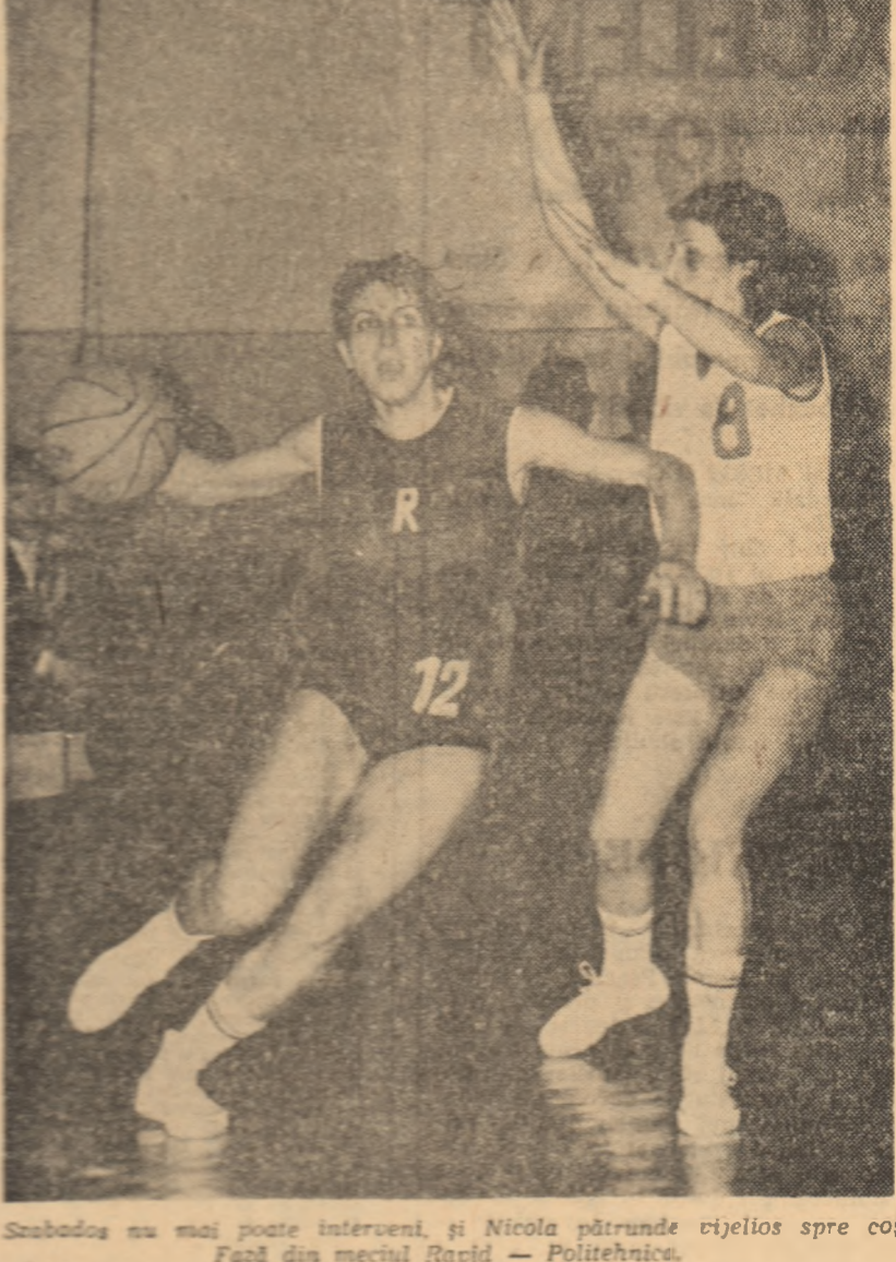
Szabados nu mai poate interveni, și Nicola pătrunde vijelios spre coș. Fază din meciul Rapid - Politehnica.