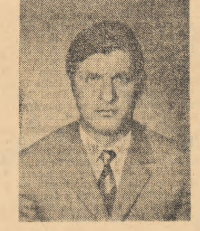
cători care caută prin orice mijloace să bazeze drumul unor jucători tineri de perspectivă solicitați de echipe superioare. Cred că a venit momentul ca federația să vină în sprijinul acestor jucători care pot activa în Divizia A. Multe talente se pierd în anonimul campionatului județean, tocmai datorită unor restricții ale regulamentului de transferări. N-ar fi rău dacă în cadrul aceluiași județ jucătorii ar fi transferați de jos în sus. Procedîndu-se așa, valoarea unor echipe divizionare din raza județului ar crește, iar jucătorii ar

rect și colorate combatante un plus valoric. — În afara competiției în sine, care credeți că este menirea Diviziei B? — După opinia mea, campionatul Diviziei B trebuie să reprezinte eșalonul de formare a jucătorilor capabili să facă față unei formații de Divizia A. Din păcate, nu toți antrenorii înțeleg acest lucru. Sărăcia de talente din prima divizie este cauzată de ideea greșită înțeleasă a unor antrenori sau condu-