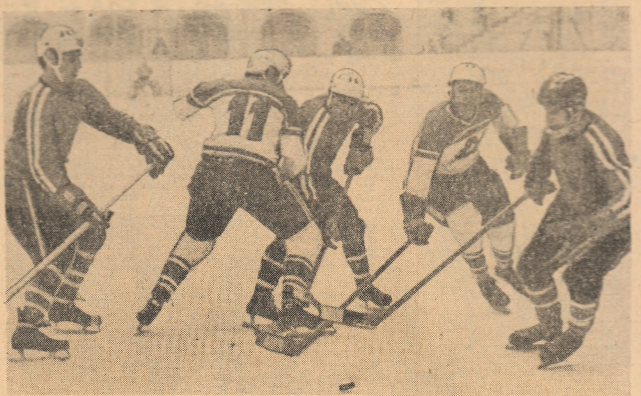
Imagine din meciul Dinamo — Steaua, disputat în turul doi al campionatului, la București, și încheiat cu rezultatul de 2-2.

în zilele de stat nu au contat, nu au contat tehnica, tehnica și sîcratice necesară realizării unui ritm curgător de joc suficient pentru a putea să valorifice în goluri lungile momente de dominare teritorială. Mîine (marți, azi) are loc mult așteptatul meci dintre aceste două echipe, confruntare care, în fond, ne poate edifica nu numai asupra valorii lor ci și — sau, poate, mai ales — asupra perspectivei echipei reprezentative în fața cercului stau în perioada imediat următoare. Călin ANTONESCU