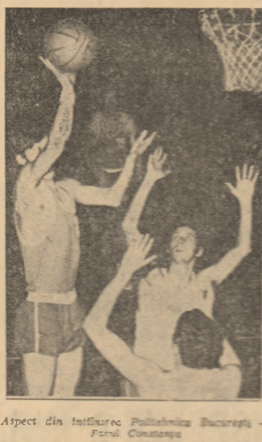
Aspect din desfășurarea Politehnica București - Farul București