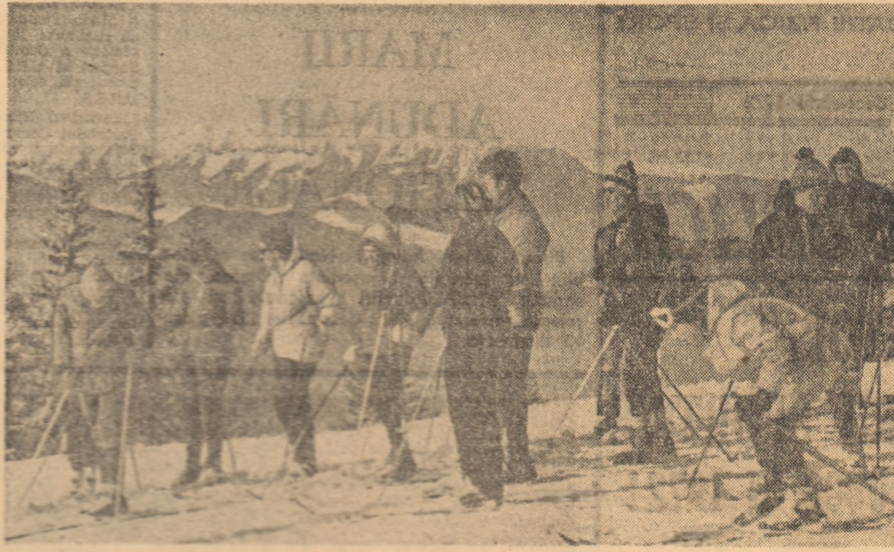
Turismul montan de iarnă este deosebit de popular...