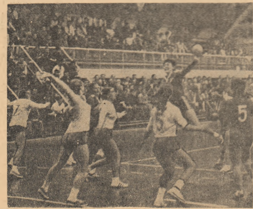
Fază din întîlnirea Universitatea București — I.E.F.S. disputată în campionatul trecut.