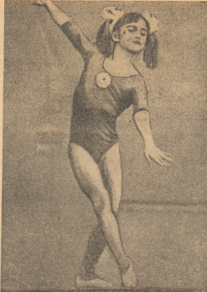
Înt-o probă pe Nadia Comănici la birnă, aparat la care exercițiul ei aproape că oprește respirația spectatorilor.

FEMININ CRISUL ORADEA - RAPID BUCUREȘTI 64-46 (30-17). Doar 12 minute au reușit fervoriaste ale orădenilor. În min. 12 scorul era 16-14 și apoi Crisul s-a distanțat, impunîndu-se categoric prin recuperări sub panou, contraatacuri și aruncări de la semidistanță, datorită în special jucătoarelor Dudas,