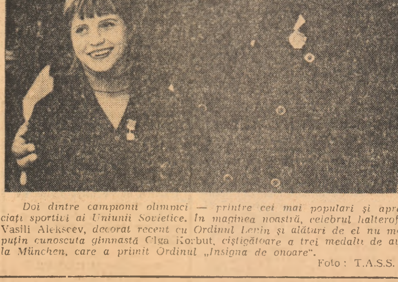
Doi dintre campioni olimpici — printre cei mai populari și apreciați sportivi ai Uniunii Sovietice. În imaginea noastră, celebrul halterofil Vasile Alexeev, decorat recent cu Ordinul Lenin și alături de el nu mai puțin cunoscuta gimnastă Olga Korbut, câștigătoare a trei medalii de aur la München, care a primit Ordinul „Insigna de onoare”.