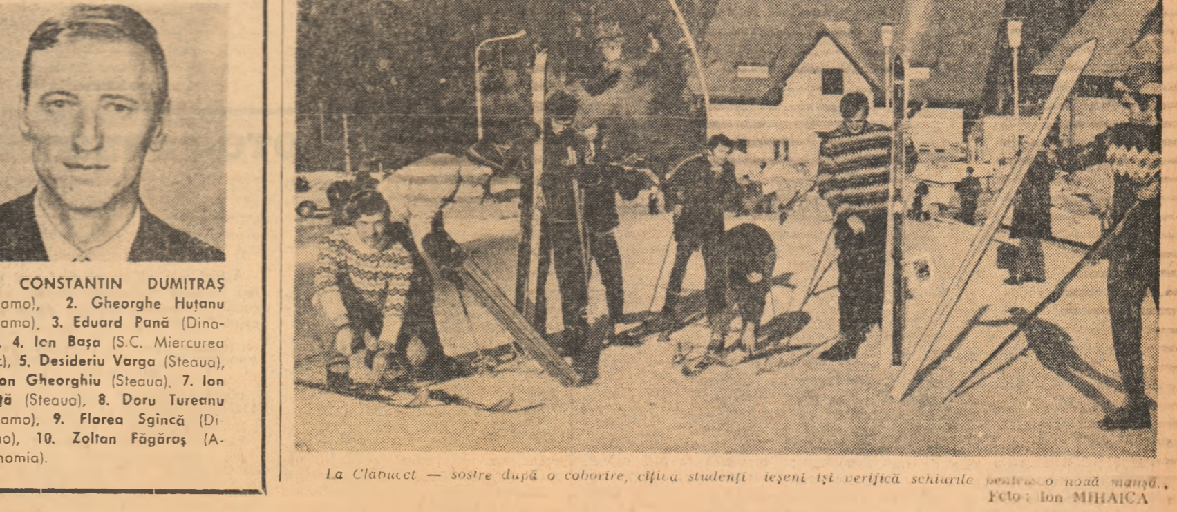
La Clănuț — sotre după o coborîre, cîțva studenți își verifică schiturile pentru o nouă mîșcă.

S-au scurs, aproape fără să ne dăm seama, luniile, a venit sfârșitul anului. Și, ca totdeauna, ultima săptămână a lui decembrie coincide cu cele mai plăcute momente de după un semestru de studiu. Sînt zilele vacanței. La această oră, stațiunile montane cele mai renumite, sau cabanele pierdute în mijlocul munților și împrejurimile lor fortoase de elevi și de studenți. La loc de frunte în programele zilnice alcătuite de comandamentele taberelor, sînt înscrise excursiile montane de diferită durată, învățarea și practicarea schiului, acolo unde această iarnă a fost ceva mai binevoitoare și mai darnică în zăpada, jocurile de cabană și, bineînțeles, dansul. Toate acestea sînt însoțite de activități de conectanță și reconfortanță pe care, ca în fiecare an, o putem înțeli acolo unde sînt tineri, și mai ales, elevi și studenți. Nimeni nu-și mai aduce aminte că a luat sfîrșit o perioadă de muncă intensă și că urmează o altă, la fel, punctată în cazul studenților, și de o sesiune de examene... Și poate că acesta este lucrul cel mai Radu TIMOFTE (Continuare în pag. 2 a)