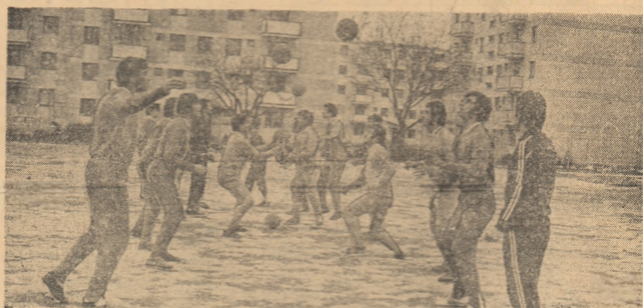
Ambișia sportivă se pot, desigur, împlini dar pentru aceasta este necesar de o pregătire intensă. Este ceea ce și-au propus și fotbaliiștii suceveni care, după cum se vede, nu s-au prea speriat de... spadă

În baza indicațiilor de partid, educația fizică și sportul trebuie să cunoască, însă, o largă dezvoltare pe întreg cuprinsul patriei, să angreneze un număr cit mai mare de cetățeni, întregul tîneret, să ofere tuturor elementelor talentate posibilitatea de afirmare în acest domeniu. Iată direcții pe care ne propunem să le urmărim în reportajele ce le vom publica sub titlul: „VIATA SPORTIVA A ORASELOR ȚĂRII”.