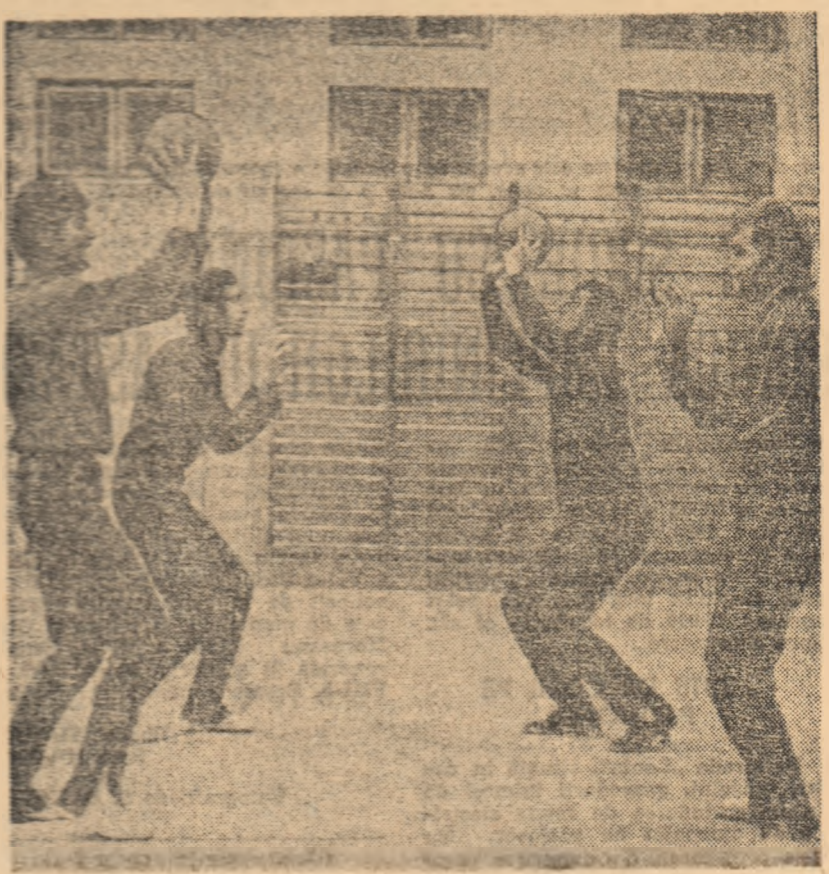
La unul din antrenamentele trăgătorilor de la C.S.M.

și mecluri mai mult ușoare decît Victoria și Danubiana din Roman, adversarii direcți. Reluarea pregătirii, în ritm susținut, și meclurile de verificare cu Textila Botoșani, A.S.A. Cîmpulung, Moldoveanu, Metalul Rădăuți, Textila Buhusi, C.F.R. Pașcani și Ceahlău Piatra Neamț oferă echipei succese posibilitatea de a-și controla potențialul.