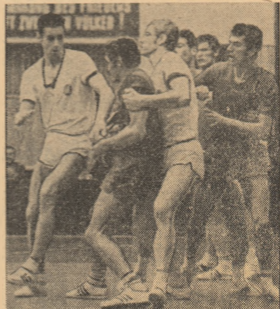
Fază dintr-o pasionantă întîlnire programată în sezonul trecut între reprezentativele României și R. D. Germane (tricoturi de culoare deschisă)