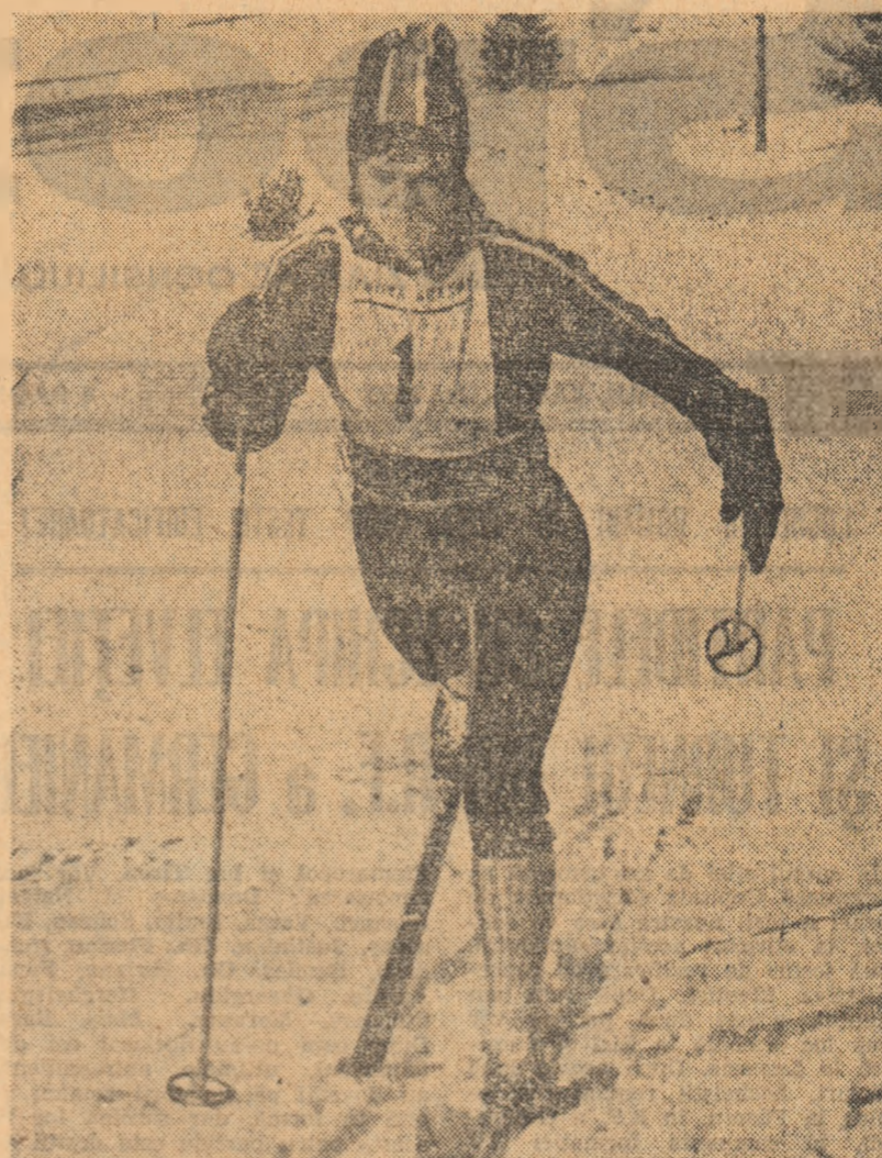
...cu oarecare încredere...

CLASAMENT FINAL: 1. Fundata-Brașovia 15 p, 2. Centrul Șirnea 67 p, 3. Șc. sp. Rîșnov 81 p.