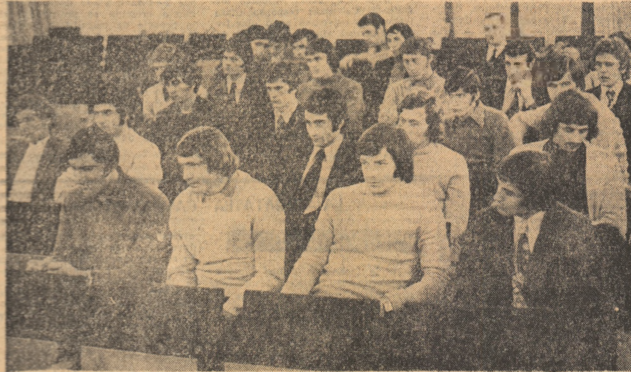
Aspect din sală, de la prima reuniune a noului lot reprezentativ de fotbal

La sediul F.R.F. a avut loc ieri după amiază prima reuniune din acest an a lotului reprezentativ de fotbal, recostituit. Au fost prezenți toți cei 25 de