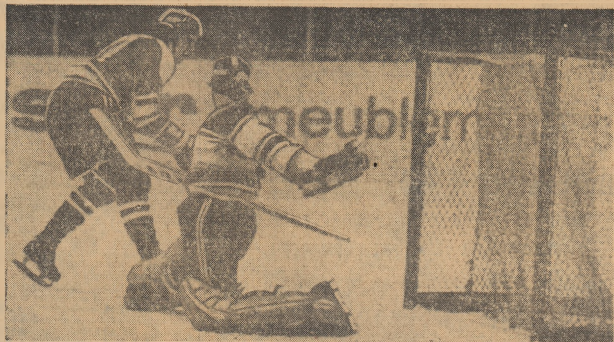
Fază din primul meci Elveția — România (2-3). Dürst reușește să înscrie cel de al doilea punct al elvețienilor.