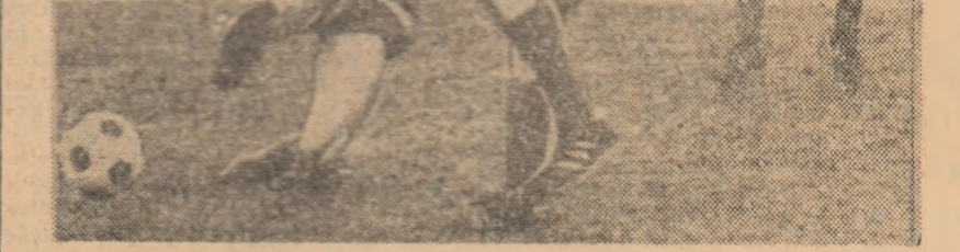
Schäfer (Kickers) deschide scorul în meciul Kickers Offenbach — Werder Bremen (2-1)

Concursul internațional de schi-fond de la Reit în Winkl (Bavaria) a debutat