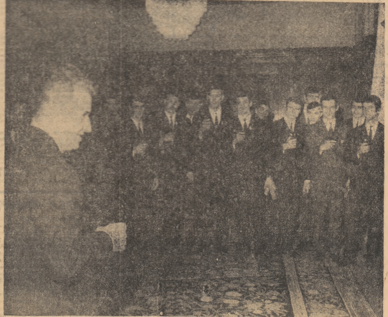
Handbaliștii români, campioni mondiali ediția 1970, primiți la Palatul Republicii, decorați și felicitări de președintele Consiliului de Stat, Nicolae Ceaușescu.

Viața tovarășului Nicolae Ceaușescu evocă și simbolizează însuși drumul de luptă și victorii pe care l-a străbătut poporul nostru, sub conducerea glorioasă a partidului. Un drum care a devenit mai bogat în fapte și împliniri de cînd tovarășul Nicolae Ceaușescu se află la conducerea partidului și statului. Înfăcărat patriot, sintetizînd experiența sa de viață de militant revoluționar, precum și experiența partidului, în întregul său, aplicînd în mod creator învățătură marxist-leninistă la condițiile României, el a știut, ca