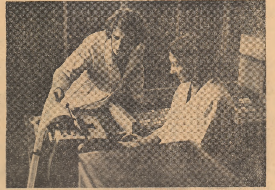
Emerson Fittipaldi, cîștigătorul de anul trecut al campionatului mondial, s-a instalat în fruntea clasamentului noii ediții cu 9 puncte, urmat de Cevert cu 5 p., Stewart cu 4 p., și Ickx — 3 p.

BUENOS AIRES, 29 (Agerpres). — „Marele premiu automobilistic al Argentinei”, primul concurs de formulă 1 pentru campionatul mondial al anului 1973, s-a desfășurat la Buenos Aires, în prezența a peste 100.000 de spectatori și a prilejului brazilianului Emerson Fittipaldi o spectaculoasă victorie, în disputa cu cei mai reușiți piloți din lume prezenți la start. La volanul unei mașini „Lotus”, Emerson Fittipaldi a parcurs 98 ture de circuit (fiecare tur a măsurat 3,354 km) în timpul de 1h 56:18,22, cu o medie orară de 165,668 km. Revelația ultimelor concursuri, francezul Francois Cevert („Tyrell Ford”) a ocupat locul doi la aproximativ 4 sec înfrîcînd la rîndul său pe Jackie Stewart (Scotia) — „Tyrell Ford”, Jacky Ickx (Belgia) — „Ferrari”, Dennis Hulme (Noua Zeelandă) — „McLaren”, Wilson Fittipaldi (Brazilia), fratele învingătorului, — „Brabham” și Clay Regazzoni (Elveția) — „B. R. M.”. După acest concurs, Emerson Fittipaldi, cîștigătorul de anul trecut al campionatului mondial, s-a instalat în fruntea clasamentului noii ediții cu 9 puncte, urmat de Cevert cu 5 p., Stewart cu 4 p., și Ickx — 3 p.