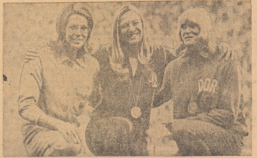
Vor rezista — în vîitor — și pe distanța de 300 m cele mai bune performanțe din lume? De la stînga la dreapta, în imaginea noastră: Heidi Rosendahl, (R. F. a Germaniei); Mary Peters (Anglia); Eugenia Pollock (R. D. Germană)

În fine, de precizat că atletismul rămîne prima ramură sportivă la nivel mondial, fiind afiliată la I.A.A.F. (N. M.).