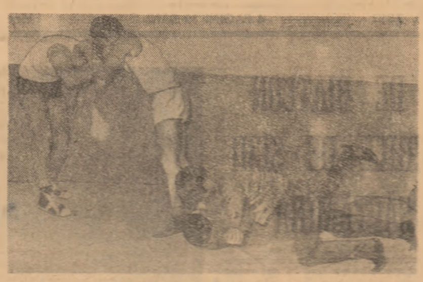
Pe cînd un antrenor pentru acționiștii tineri cere interes sportivii lui?