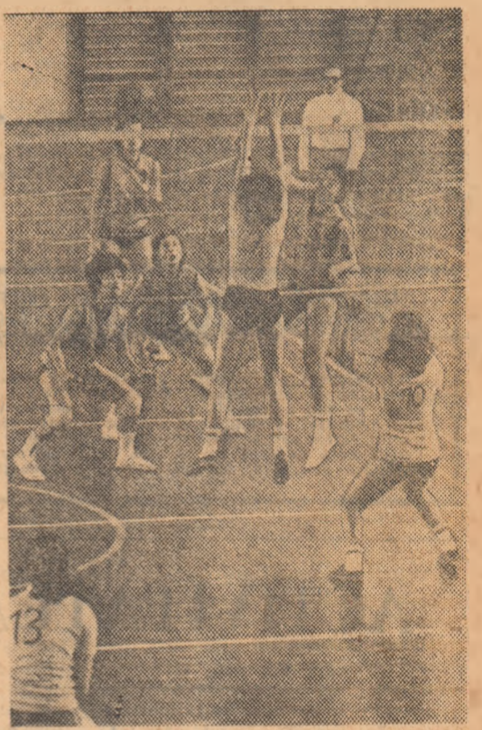
I.T.B., una din fruntașele diviziei secunde femi- nine, nu a lăsat nici o șansă voleibalistelor de la Voinea Buzău, cîștigînd cu 3-0 partida disputată duminică în sala Progresul din Ca- pitală.

MASCULIN: I.E.F.S. — Electra, Rapid — Voinea Arad, Steaua — C.S.U. Galați, Viitorul Bacău — Progresul, U- niversitatea Craiova — „U” Cluj, Tractorul Brașov — Dinamo Bucu- rești. FEMININ: Uni- versitatea București — Ceahlăul P. Neamț, Di- namo — Penicilina, Me- dicina — „U” Cluj, U- niversitatea Timisoara — Constructorul, Farul — I.E.F.S., C.S.M. Sibiu — Rapid. Meciurile din Capitală se vor disputa după următorul program: Sala Institutului Pedagogic, ora 17: Universitatea — Ceahlăul (A, f); sala Floresca, de la ora 17: Steaua — C.S.U. Galați (A, m), I.E.F.S. — Electra (A, m); sala Dinamo, de la ora 17: Medicina — „U” Cluj (A, f), Dinamo — Penicilina (A, f); sala Giulești, ora 17: Rapid — Voinea Arad (A, m).