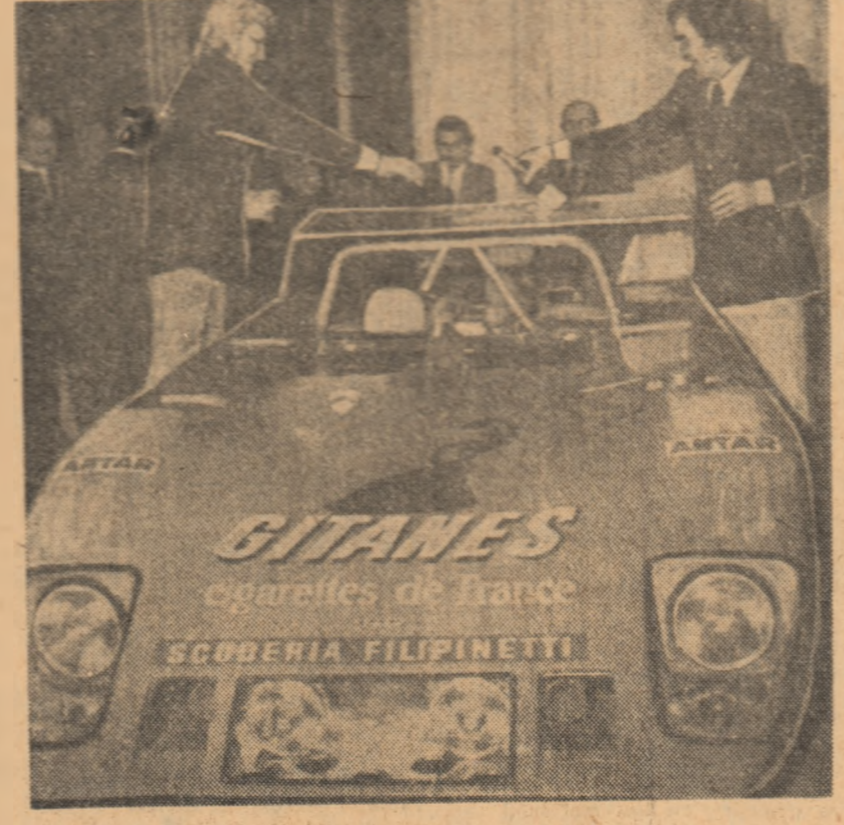
Nici celebrele figurate „Gitanes” nu se pot dispensa de publicitatea prin automobilele de val...