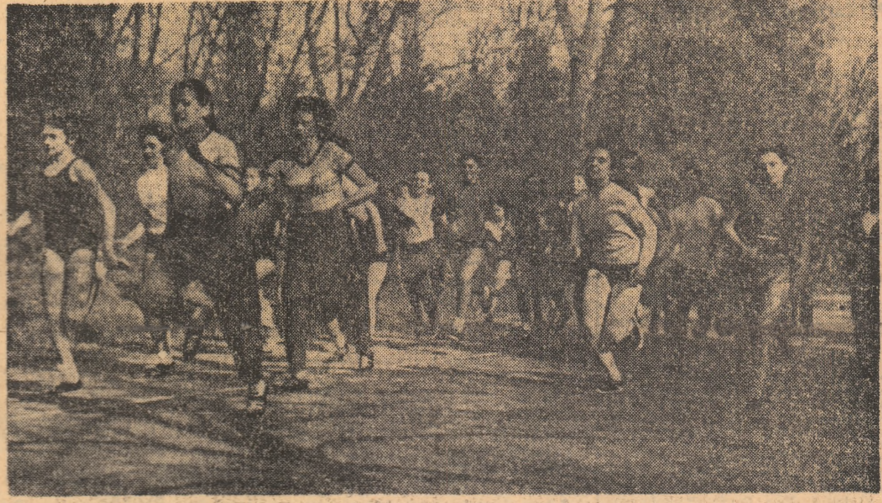
Această aprigă întrecere a elevilor din Cluj ne dezvăluie frumusețea și spectaculozitatea crosului