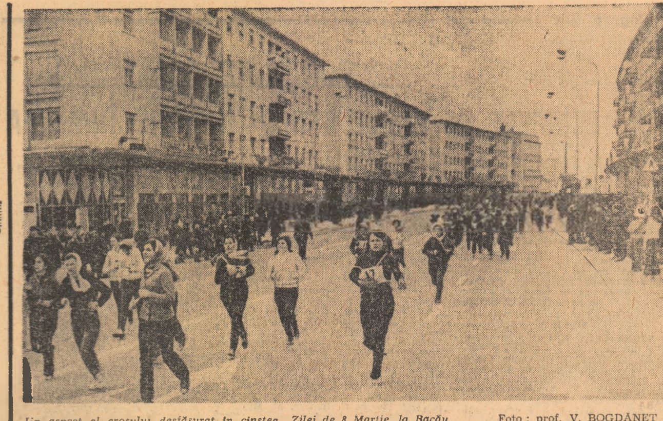
Un aspect al crosului desfășurat în cinstea Zilei de 8 Martie, la Bacău.