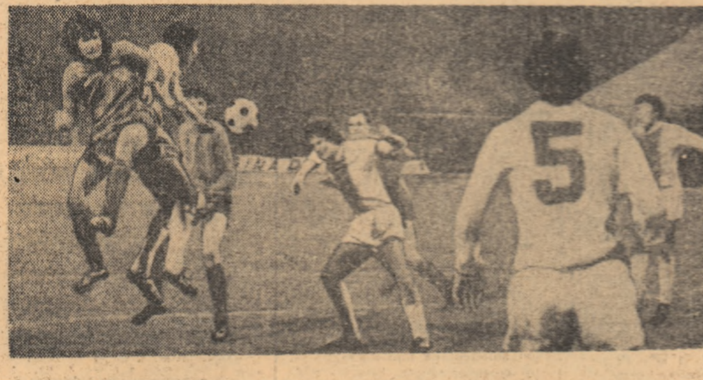
Succesul din partida...