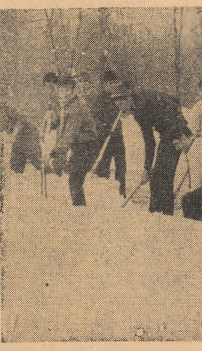
Hainele au rămas agățate pe poarta de handbal și tinerii sportivi dinamoviști au trecut la deszăpezire pentru ca parcul lor sportiv să fie redat activității.

Mai puțin afectat de căderile masive de zăpadă, municipiul Satu Mare va fi gazda unor întreceri de masă de amploare. La „Crosul marșatorului“ se vor prezenta aproximativ 1 000 de tineri, alții urmînd a lua parte la concursul de carturi, la competiția de ciclism dotată cu „Floarea prieteniei“, precum și la cele de minifotbal, handbal, tenis de masă, volei și natina pe rotile. Din alte colțuri ale țării aflăm vești despre competiții asemănătoare. La Zalău și Șimleul Silvaniei vor avea loc „Crosurile primăverii“, iar la Slobozia, Călarși și Fetești se vor organiza întreceri de sîniute.