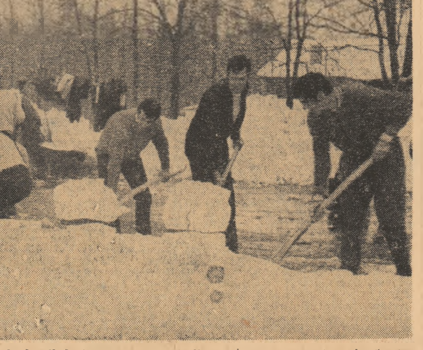
Hainele au rămas agățate pe poarta de handbal și tinerii sportivi dinamoviști au trecut la deszăpezire pentru ca parcul lor sportiv să fie redat activității.

să se introducă starea de necesitate. Participanți entuziași la toate acțiunile desfășurate pînă acum pentru deszăpezire și lichidarea urmărilor viscolului, sportivii se simt angajați, în continuare, cu răspunderea datorită cetățenilor, în acest admirabil efort colectiv și sînt gata să îndeplinească exemplar misiunile ce le vor fi încredințate.