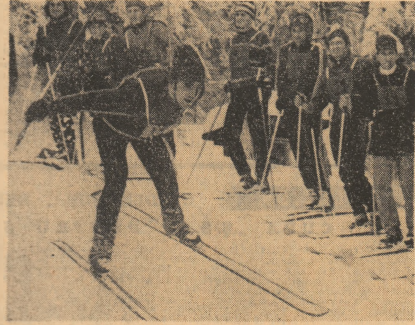
Încă unul dintre finaliștii „Cupei tineretului de la sate” a luat startul

TINERI SĂTENI DIN 25 DE JUDEȚE LA FINALELE DE SCHI DE LA POIANA BRAȘOV