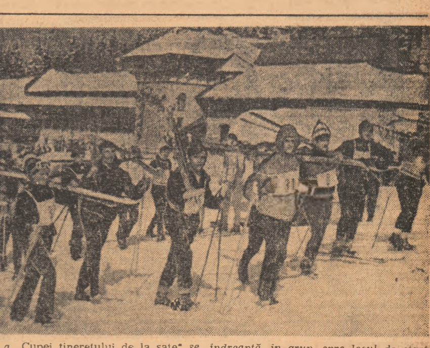
Participanții la faza finală de schi a „Cupei tineretului de la sate” se îndreaptă, în grup, spre locul de start.

În cartierul Calea Severinului, în zona asociației de locatari C.T.2, se desfășoară, anul, în două etape, EDIȚIA DE IARNĂ ȘI CEA DE VARĂ. Prima, orientată, normal, spre sporturile specifice anotimpului rece, cuprinde schiul și săniușul, disciplinele să zăpezii, tenisul de masă și şahul sportului de sală. Dintre aceste ramuri sportive, trei (săniușul, tenisul de masă și şahul) se opresc la nivelul etapelor județene, în timp ce a patra, schiul, s-a aflat anul acesta la a doua ediție cu finală pe țară. Alte trei ediții anterioare s-au desfășurat pînă la faza județeană.