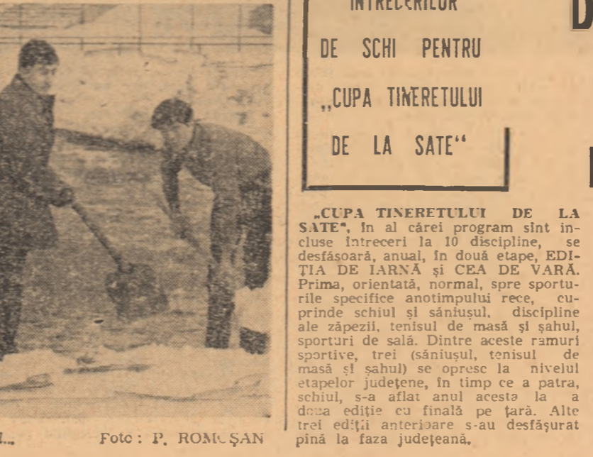
Tinerii cooperatori bucureșteni lucrînd la deszăpezirea terenului de fotbal...