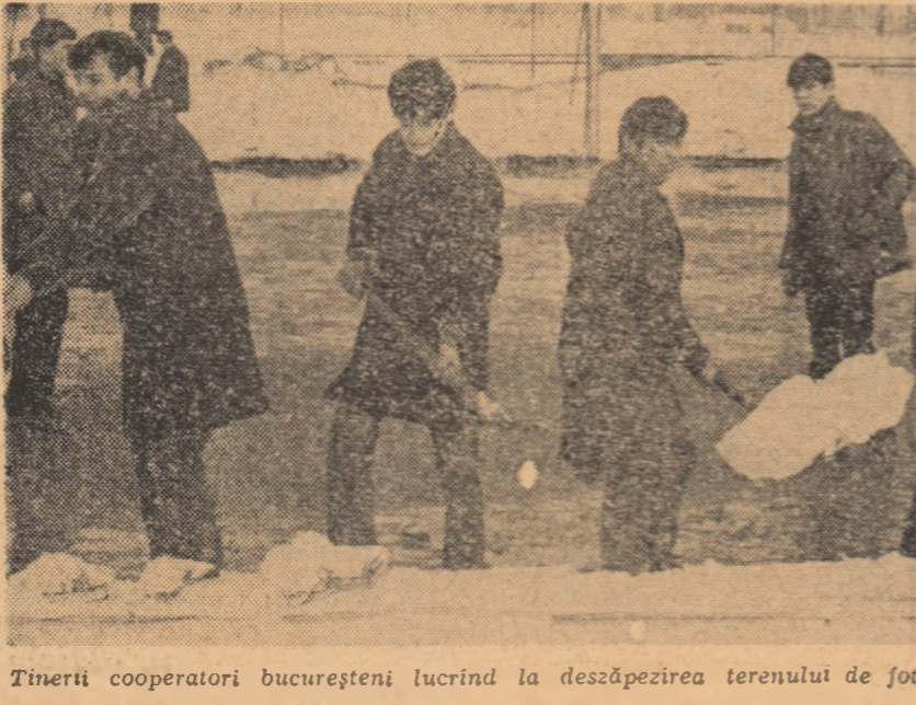
Tinerii cooperatori bucureșteni lucrînd la deszăpezirea terenului de fotbal...