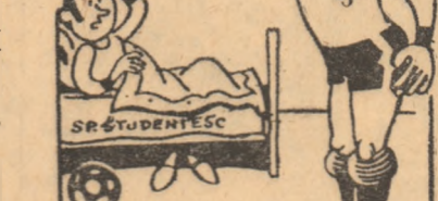
Cesul al 12-lea... deșteptarea Desen de A. CLENCIU

denii bucureșteni sînt, însă, optimiști. Ei văd că cel mai bun 11 și, nu trebuie uitat, ar de partea lor avantajul terenului. După părerea noastră, ei au prima șansă în obținerea victoriei.