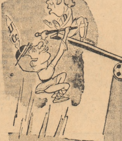
Cine va fi lider, duminică seară? Desen de G. BADEA

DOII CANDIDATI PENTRU POSTUL LUI VELEA. In cursul acestei saptamini, fotbalistii craioveni au efectuat sapta antrenamente, inchetate vineri cu un joc-scoală.