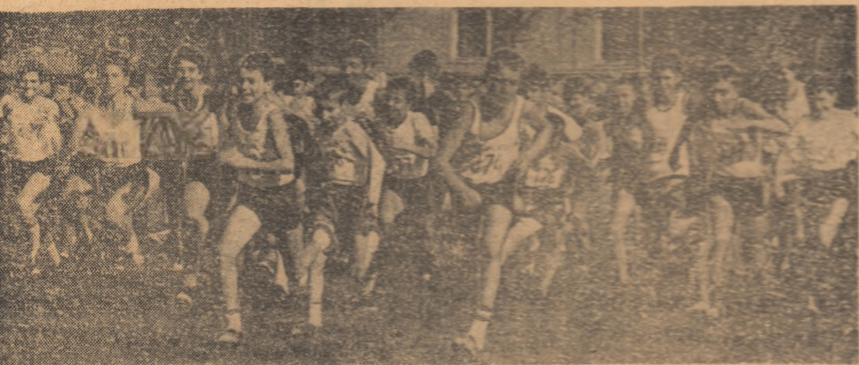
ÎN LUMINA HOTĂRÎRII PLENAREI C.C. AL P.C.R. CU PRIVIRE LA DEZVOLTAREA CONTINUĂ A EDUCAȚIEI FIZICE ȘI SPORTULUI

În fața noastră s-a desfășurat un spectacol interesant (au asistat peste 6.000 de persoane pe un timp noros și cu vînt).