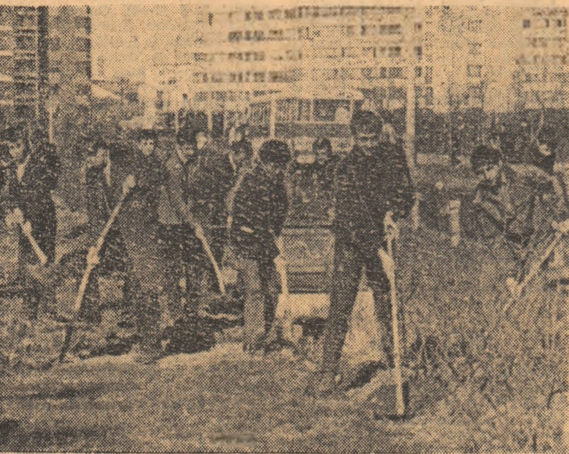
Pe bilevardul Ion Șulea se pregătesc brazdele pentru arbuștii și florile care vor mărgini această mare arteră a Capitalei.

TINERETUL PARTICIPĂ ENTUZIAȘT LA ACȚIUNEA DE SĂDIRE A POMILOR, LA ÎNFRUMUȘETAREA ORĂȘELOR