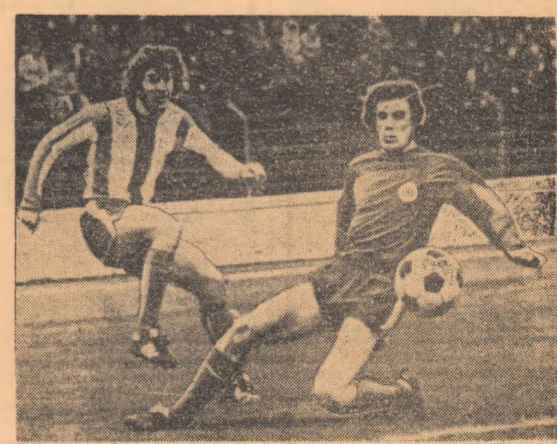
Fază din partida F.C. Kaiserslautern - Fortuna Düsseldorf, disputată în campionatul vest-german. În imagine, un înaintaș localnic zătează la poartă cu toată opoziția adversarului său.