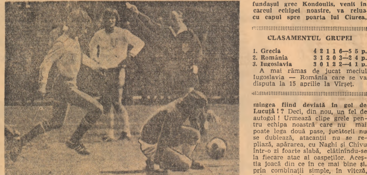
Negruțiu (nu se vede în fotografie) a șutat formidabil de la 16 m și, după ce a scuturat plasa porții lui Arvanitidis (căzut) balonul a revenit în teren. Arbitrul arată centrul terenului.

mingea ricoșează în plasa porții lui Ciurea: 2-1. Gață nepermiisă, care ar fi putut să fie reparată în min. 49, cînd Răducanu, într-o poziție foarte bună, s-a încapătînat să dirijeze înfundat în loc să șuteze la poartă. A driblat pînă a pierdut mingea, arătîndu-și dezaprobarea tribunelor. Și, în loc de 3-1, scorul va deveni imediat 2-2, fundușul grec Kondulis, venit în careul echipei noastre, va relua cu capul spre poarta lui Ciurea,