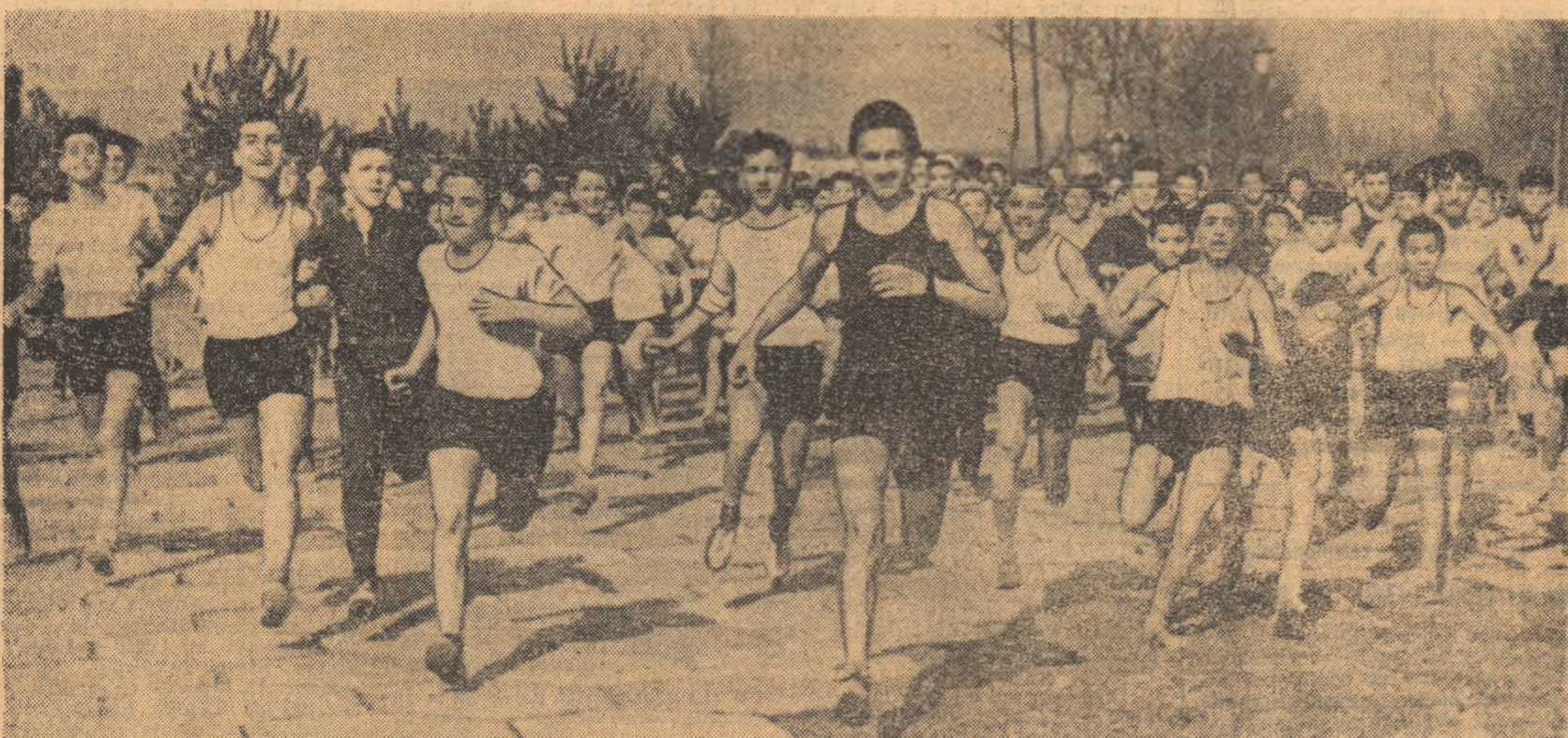
La câteva clipe după unul din starturi în „Crosul primăverii” — sectorul 5 al Capitalei. După cum se poate vedea, a fost o participare masivă și entuziasă. Crosul de masă tinde să-și revină în drepturi!

Prima duminică a acestui aprilie, caldă și însorită, a coincis cu o veritabilă sărbătoare a sportului de masă, a crosului în special, care a angrenat — la nivelul fiecărui sector al Capitalei și în multe crosuri ale țării — mii și mii de participanți, băieți și fete din școli și întreprinderi.