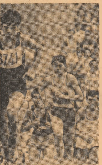
Alergările de cros, activitate sportivă larg accesibilă maselor de tineri de amatori ai muncii, cuceresc tot mai mulți adepți, pretutindeni, la orașe și în mediul rural.

● Mari croșuri în Capitală și în țară ● „Duminica porților deschise” pentru copii ● „Festivalul fetelor” la Constanța ● Serbare cîmpenească polisportiva la Pucioasa