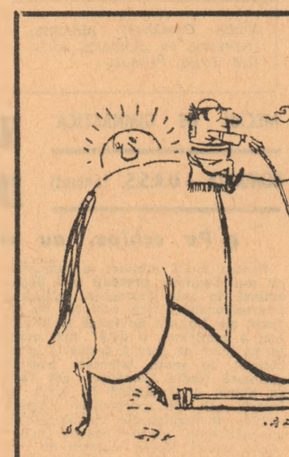
Vă invităm să descoperiți cele 7 diferențe dintre aceste două desene ale caricaturistului CLAUDIU (unul dintre aceste desene este inversat)