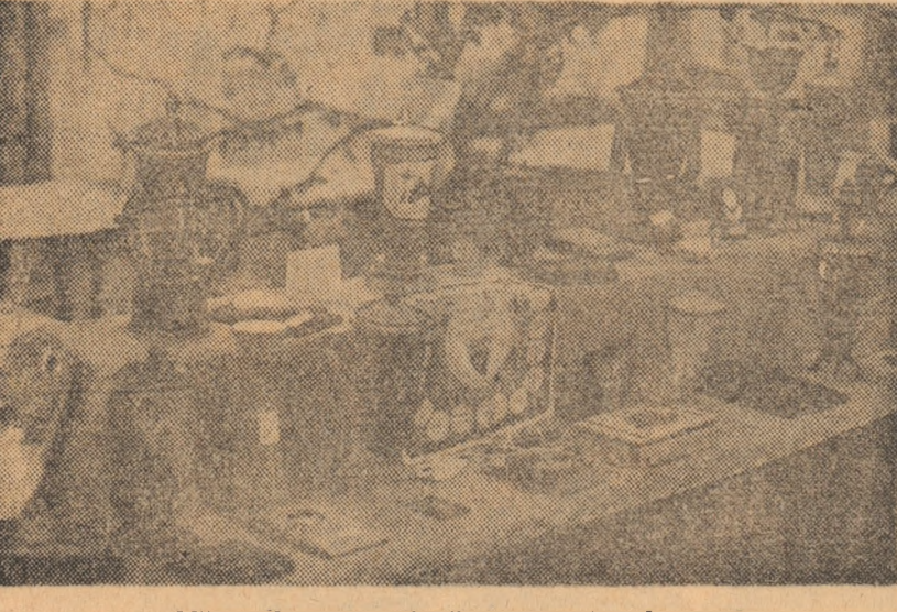
Mărturiile unei activități de-un sfert de secol.