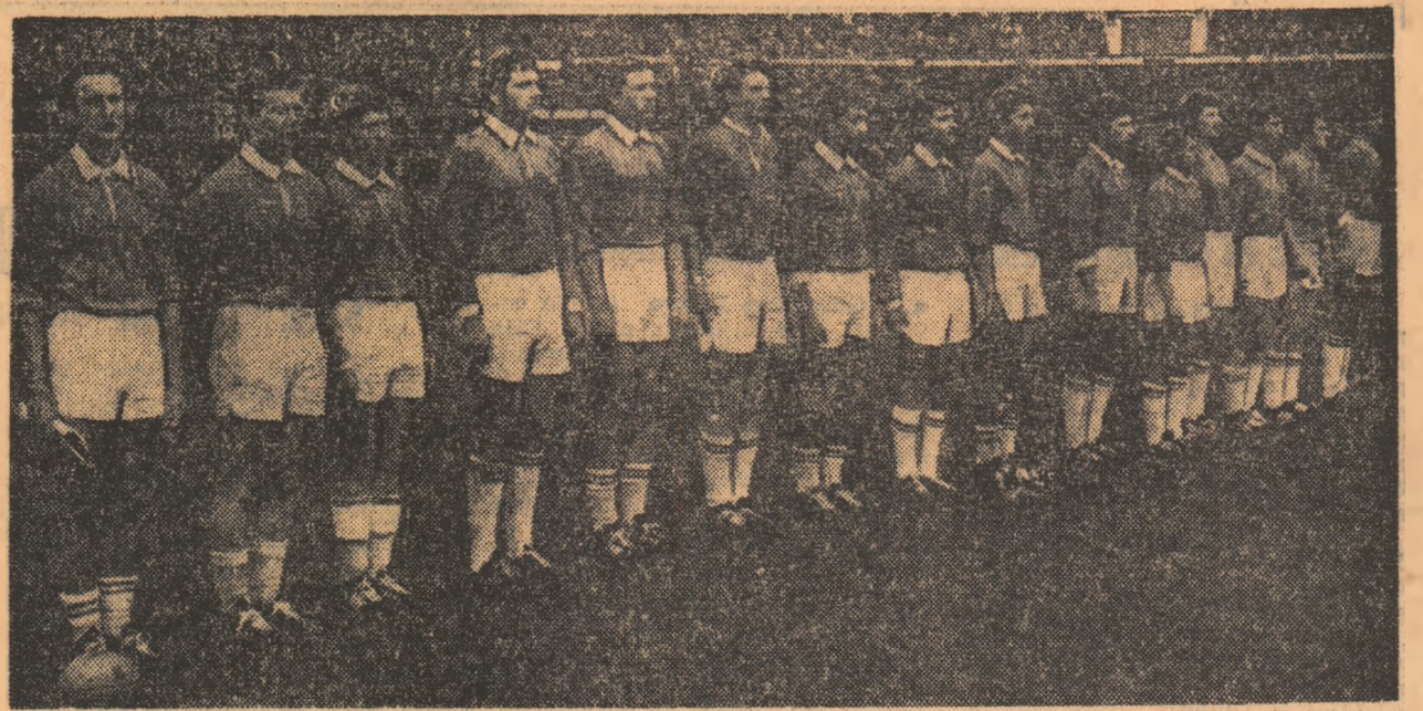
RUGBYUL NOSTRU ARE UN „SCHIMB DE MÎINE” PROMIȚĂTOR