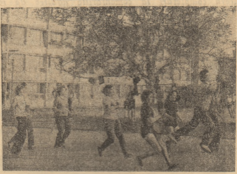
Studentele facultăților bucureștine de Matematică și Chimie, la orele de fizică...