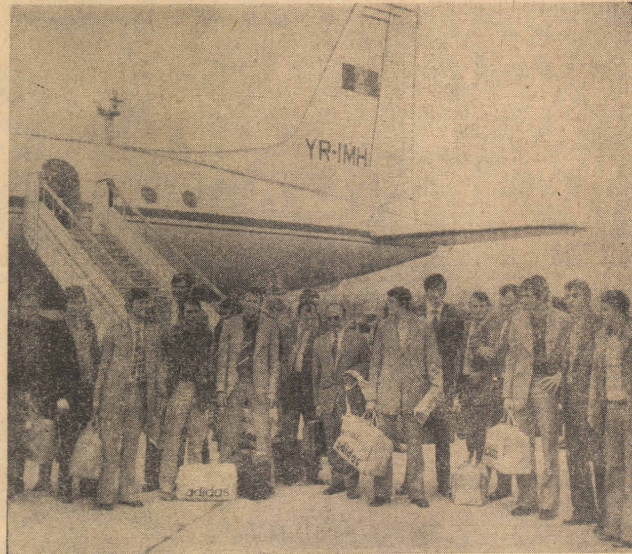
Tricolorii, ieri pe aeroportul Otopeni, la cîteva momente după ce au coborît din avionul care i-a adus de la Tirana

Nu este mai puțin adevărat însă că, față de meciul de la Kiev cu reprezentativa U.R.S.S., „team”-ul nostru reprezentativ a abordat acest joc cu Albania (care ne producea, și pe bună dreptate, destule griji) și cu alte atu-uri (în afara celor amintite și care țineau de pregătirea propriu-zisă). Ne referim, anume, la posibilitatea pe care a avut-o antrenorul selecționei de a alcătui un „unsprezece” mai reprezentativ, decît cel de la 18 aprilie, în sensul că acum i-a putut folosi pe Dinu și pe Iordănescu, două piese de bază ale echipei naționale la ora actuală și a căror prezență printre tricolori s-a repercutat pozitiv în toate compartimentele. În întregul „bloc-funcțional” al echipei. Apărarea, alt de vulnerabilă la Kiev, a câștigat în siguranță și încredere prin introducerea lui Dinu iar atacul a simțit și el sportul lui Iordănescu nu numai prin „plusul combinativ” cu care a venit stelistul ei și prin creșterea puterii de finalizare. Vom sublinia că, în plus, acești doi jucători, reîncadrați în echipă la momentul oportun, au întărit și jocul la mijloc, cunoscută fiind predilecția lui Dinu pentru acțiuni de mai larg suflu decît jocul rigid de fundaș central, ca și ideea tactică privitoare la Iordănescu, ca acesta să joace un așa-zis „centru doi rezerve”, rol pe care la Tirana l-a