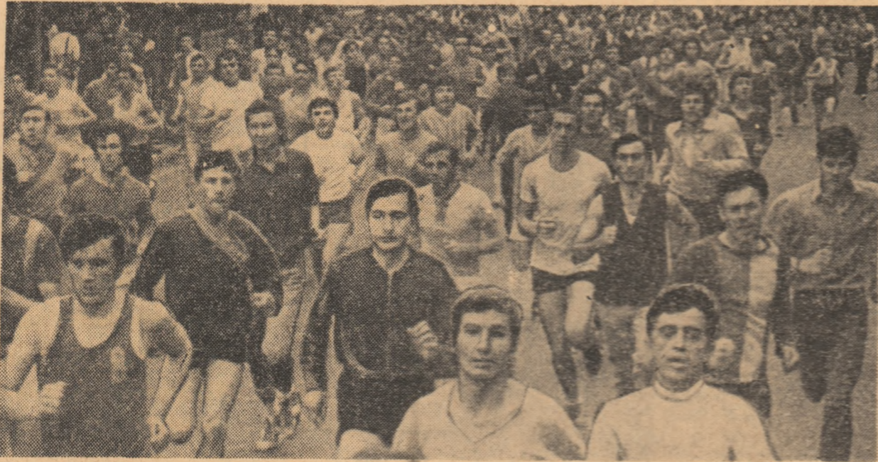
Crosul tineretului își dispută astăzi ultima etapă. La facele anterioare au fost prezenți mii de tineri.

• Bogat program premergător întrecerilor • Paralel cu finaliștii, se vor întrece alți 15 000 de tineri arădeni și veteranii • Cursa... organizatorilor se desfășoară cu succes