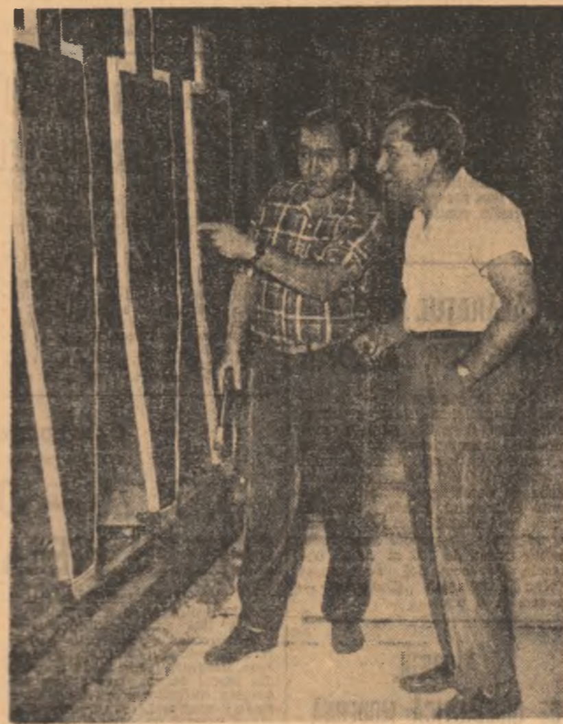
În fața fiintelor, un schimb de păreri între două celebriități mondiale ale pistoliștilor viteză...