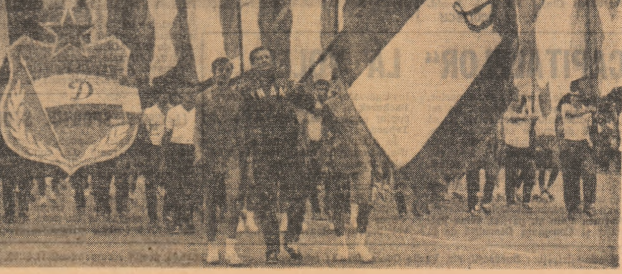
În prezent, în grupele de copii și juniori ale clubului Dinamo activează peste 300 de sportivi...