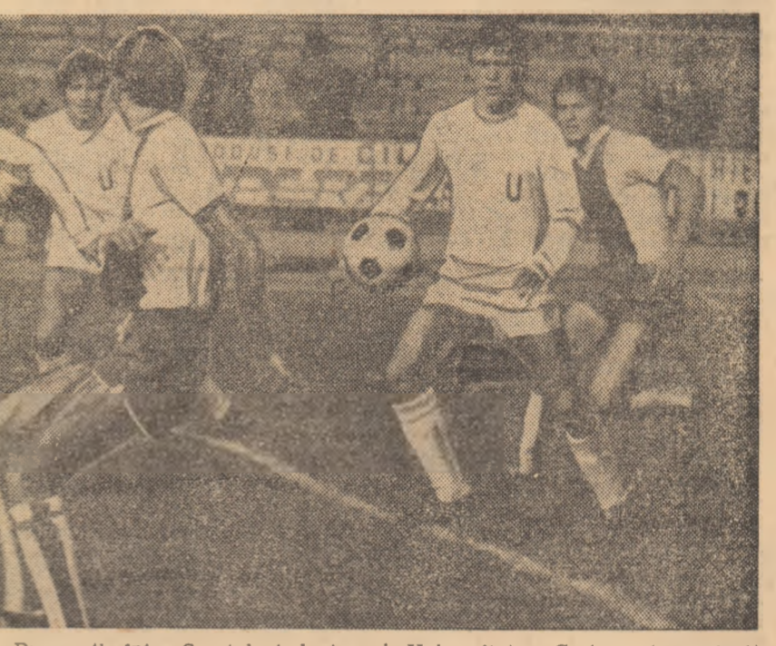
Fază din partida disputată în tur, la București, între Sportul studențesc și Universitatea Craiova (scor 1-1). Astăzi, pe stadionul din Craiova se anunță o dispută la fel de echilibrată și interesantă

Azi, o nouă etapă în Divizia A la fotbal. Considerentele acestei programări se cunosc. Ținînd seama că la 27 mai echipa națională va susține una din partide-cheie din grupa preliminară a C.M. și pentru a pregăti în condiții optime meciul respectiv, cu R. D. Germana, federația a hotărît și ea etapa a XXIV-a să se dispute azi.