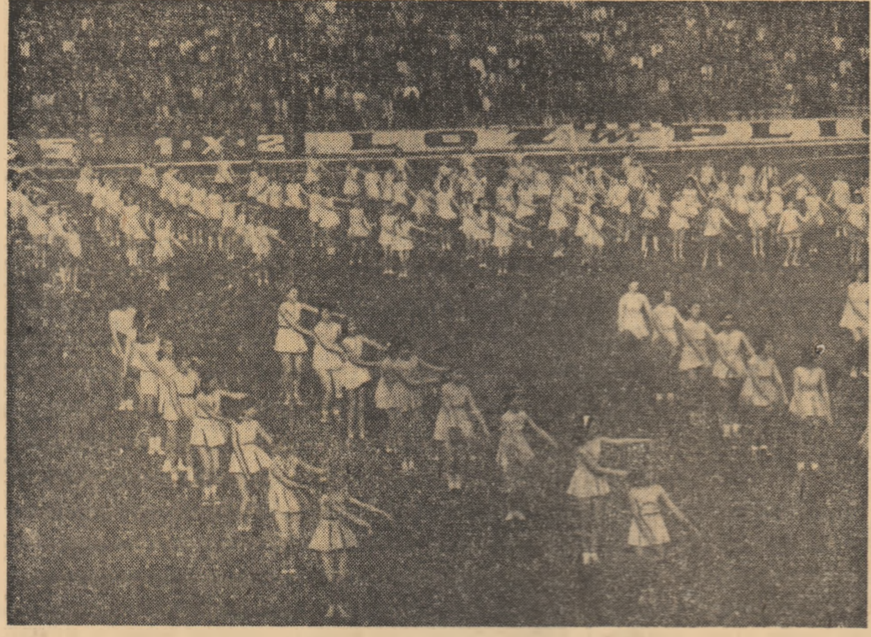
TRANSPUNIND IN VIAȚĂ HOTĂRÎREA PLENAREI C.C. AL P.C.R. CU PRIVIRE LA DEZVOLTAREA CONTINUĂ A EDUCAȚIEI FIZICE ȘI SPORTULUI